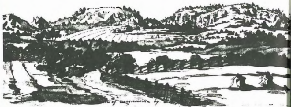
Maunukselan kylä v. 1747. Vas:lla Ket- tumäki, sen juurella Killingin kantatalo, oik:lla Naukionvuori. Augustin Ehrensvärdirin piirros.

Kirjoittaja tulee jatka- maan yhtiötä, Kuusan- koskea ja työssään saa- miaan vaikutelmia käsit- televää sarjaansa, josta tähän mennessä on il- mestynyt kolme osaa, lehtemme seuraavassa numerossa. Tällä kertaa julkaisemme erillisen, seudun varhaisemmasta historiasta, nimenomaan Kuusanniemen kylän vai- heista kertovan esitel- män, jonka kirjoittaja piti Kuusankosken kotiseu- tujuhlissa viime elo- kuussa. Usealta taholta on esitetty toivomus esi- telmän julkaisemisesta. Samalla kirjoittaja esit- tää pyynnön vanhan muistitiedon saamisesta erityisesti siitä vaihees- ta, jolloin talonpoikai- suus alkoi vähitellen hä- viitä tehtaalaisuuden tiel- tä. Erityisesti kiinnosta- vat tiedot tehtaalaisista kortteerimiehinä maa- laistaloissa, talollisten siirtyminen tehdastyöhön ja talollisten sekä tehta- laisten väliset tonttima- ta koskevat vuokrasopi- mukset. Muukin tämän- tapainen perimätieto otetaan kiitollisena vas- taan. Ottakaapa yhteyttä tiedotusosastoon.