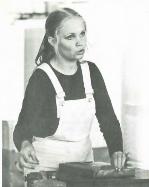
Näyttelyn ilmeikkäimpiä valokuvia nähtiin riisinkäärijän työskentelyä esittelevässä kahdeksan kuvan sarjassa.