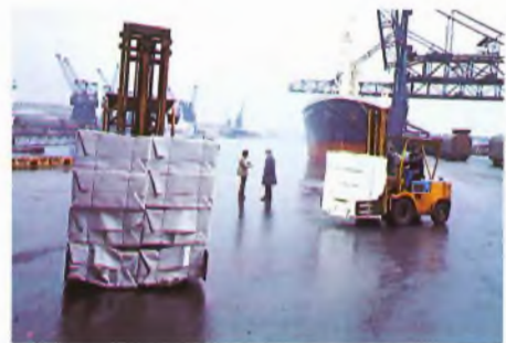
Ensimmäiset sellutoimitukset Kuusanniemen sellutehtaalta lähtivät Ranskaan keväällä. Suomen lisäksi sellua saapuu Calais'n satamaan Kanadasta, Neuvostoliitosta ja Chilestä sekä tietenkin myös Ranskasta.

Docelles'n tehdas käy neljässä vuorossa. Aamuvuoro alkaa jo klo 4, päivävuo-ro vastaavasti klo 12 ja yövuoroon lähdetään klo 20. Kesäloimat ovat neljän viikon pituisia. Syyskuus-