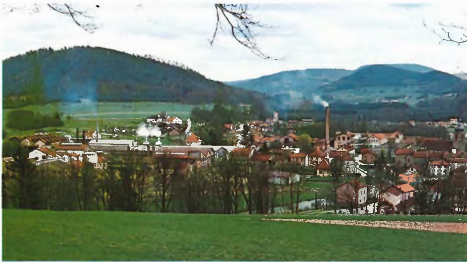
Docelles sijaitsee Koillis-Ranskassa, Vogeesien vuoristossa. Idyllinen pikkukaupunki elää rauhallista elämäänsä metsäisten mäkien ympäröimänä. Boucher-yhtiön paperitehdas kuvassa vasemmalla.

● Perinteikäs ja omaleimainen. Kiehtova sekoitus uutta ja vanhaa. Arvoituksellinen ja yllättävä. Tätä kaikkea on Kymiyhtymän kansainvälisen paperiryhmän uusin tulokas, ranskalainen Papeteries Boucher S.A., joka on nyt puolen vuoden ajan kuulunut yhtymän hallintaan.