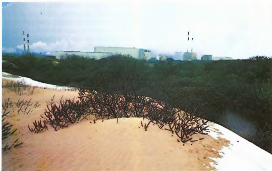
Calais'n tehdas kohoaa hiekkadyynien keskeltä kuin kangastus erämaassa. Huhtikuussa otetusta kuvasta ilmenee, että Pohjois-Ranskassa oli tänä keväänä yllättävä takatalvi. Tehdas rakennettiin vuonna 1969 ja Docelles'sta siirretty paperikone lähti käyntiin vuonna 1970.