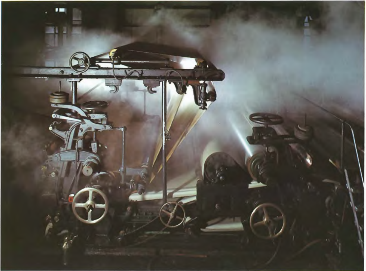
Pauli Bergström/pf-studio Helsinki