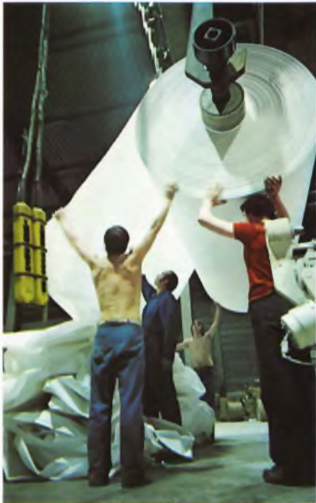
Valmis rulla saamassa loppusilausta Calais'n tehtaalla.

Calais'n tehdas sijaitsee kaupungin uudella teollisuusalueella aivan kanaalin tuntumassa. Maisema on autio, lähes kokonaan hiekkadyynien peitossa. Tehdas seisoo melkein aavemai-