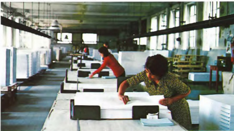
Docelles'n tehtaalla on pienehkö arkkisali, missä leikataan ja lajitellaan pääasiassa off-setpainopaperia. Tehtaan kehitysnäkymiin kuuluu arkkisalin laajentaminen; arkkituotanto nostetaan kolmanneksen koko tuotannosta.