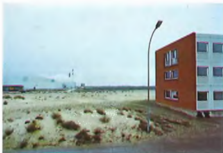
Calais'n tehtaan hallintorakennus (oik:lla) sijaitsee erillään tehtaasta, joka on aivan kanaalin tuntumassa.

Koneella valmistetaan kirjoituspaperia, vihkopaperia, kirjekuoripaperia sekä offsetpainopaperia. Lisäksi tehdään valkaistua kraftlineria, jota