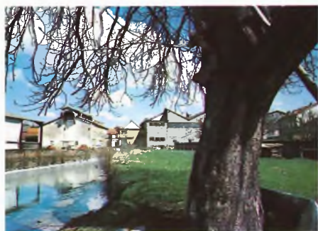
Kaupungin halki virtaava Vologne-joki on alunperin ollut Docelles'n tehtaan valtasuoni.

Kymiyhtiötä asia alkoi kiinnostaa. Ranska oli todettu yhtiön piirissä mahdollisuuksien maaksi jo paljon aikaisemmin, sillä paperia oli maahan myyty jo vuosikymmeniä hyvällä menestyksellä ja oman myyntikonttorinkin perustaminen lähelle Pariisia v. 1973 oli osoittautunut onnistuneeksi päätökseksi.