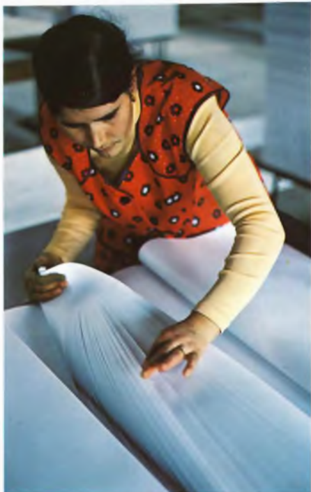
Arkkipapereiden lajittelu kuuluu Docel-les'n tehtaan ohjelmaan. Paino- ja kirjoituspapereiden ohella valmistetaan myös valkoista kraftlineria sokeripusseja varten.

sa mukana myös Oy Kaukas Ab, mutta se luopui hankkeesta myöhemmin.