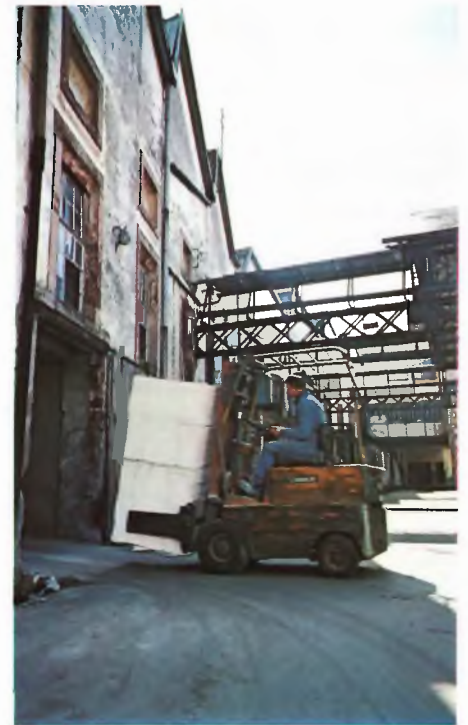
Sellupaalien siirto varastosta tehtaan toiseen kerrokseen tapahtuu erityistä 'serpeniiniväylää' pitkin.