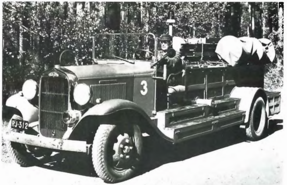
Haukkasuolla oleva Reo-paloauto on yhä kulkukunnossa. Autolla ajeli mm. neljäkymmentävuotia Tähteen koulun oppilasta Verlassa kirjoituskilpailun palkintomatallaan.