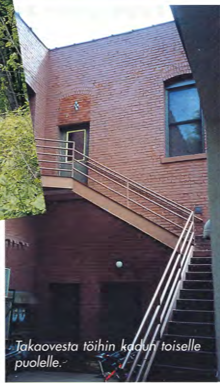
Takaovesta töihin kadun toiselle puolelle.