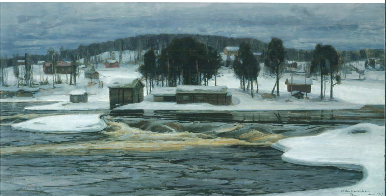
Victor Westerholm: Talvipäivä Kymijoella (1919)

Suomalaista taidetta UPM-Kymmeneen kokoelmasta Helsingin Taidehallissa 11.10.–11.11.2001