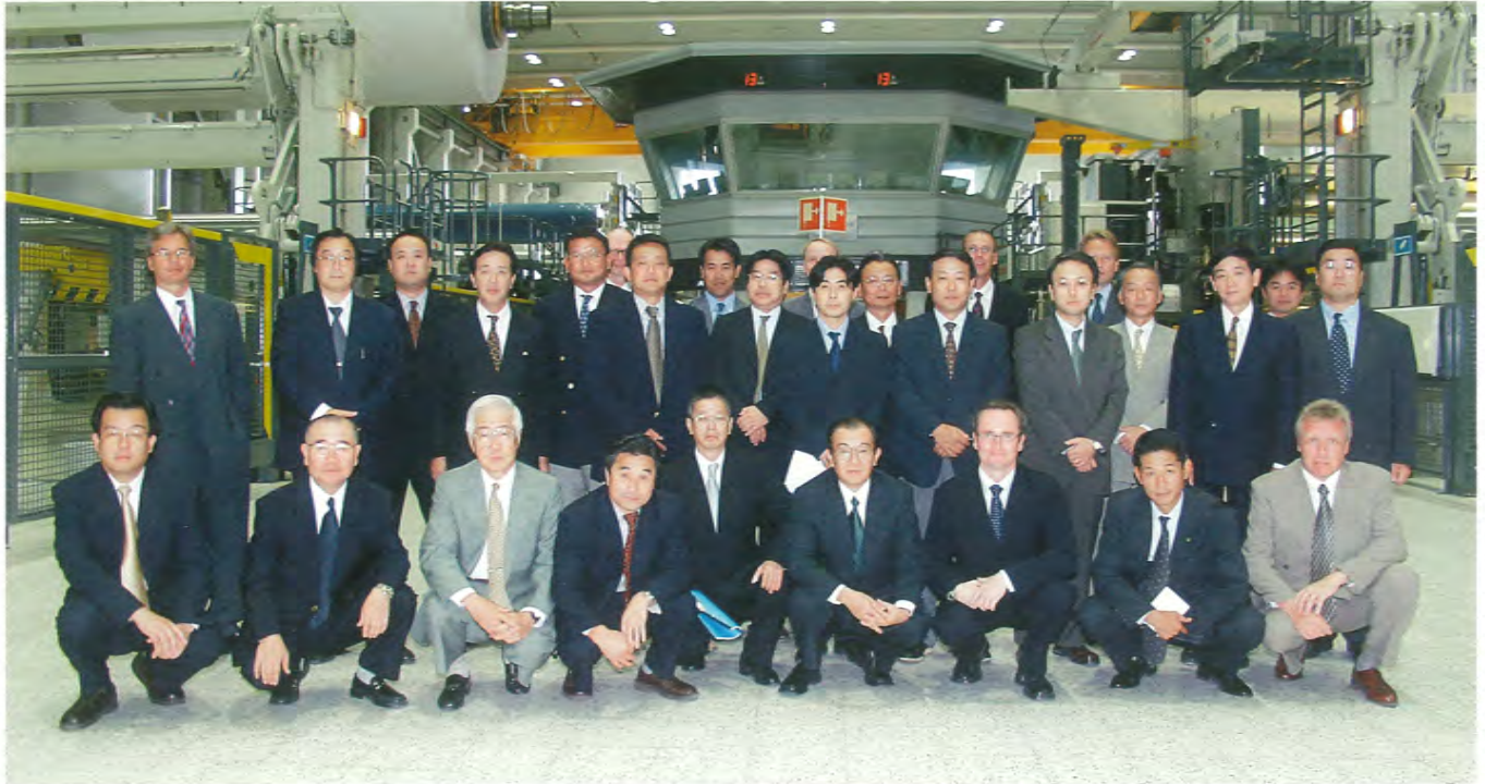
Japanilaisvieraat isäntineen Kymi Paper Oy:n uuden päällytyskoneen konehallissa.