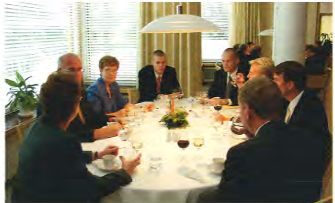
Kuusankosken kaupungin ja Kymin väkeä Koskelan soikeassa pöydässä.