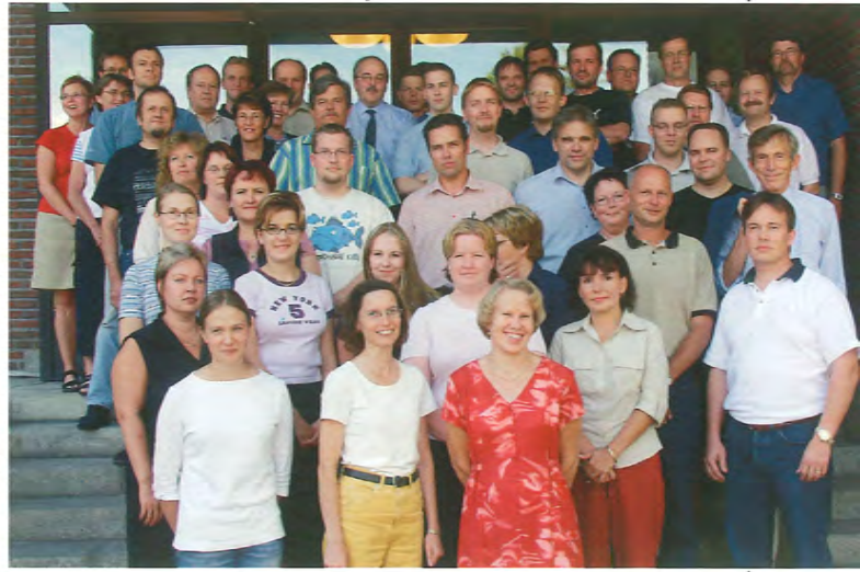
Tietohallinnon väki isännöi nyt Kymin entistä keskuskonttoria - nykyisin Griffin Housea.