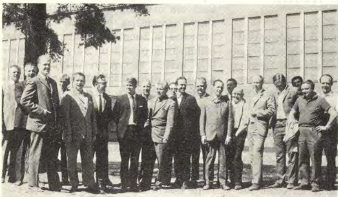
Kymin ja Voikkaan paperitehtaan tuotantokomiteiden jäsenet tutustumiskäynnillä Heinolan tehtaalla

Yhtiöläisiä varten laadittu yhtiön toimintakertomus vuodelta 1969 on valmistunut ja jaetaan asianomaisille tämän Tiedotuslehden mukana. Kertomus on aikaisempia jonkin verran laajempi ja sisällöltään monipuolisempi.