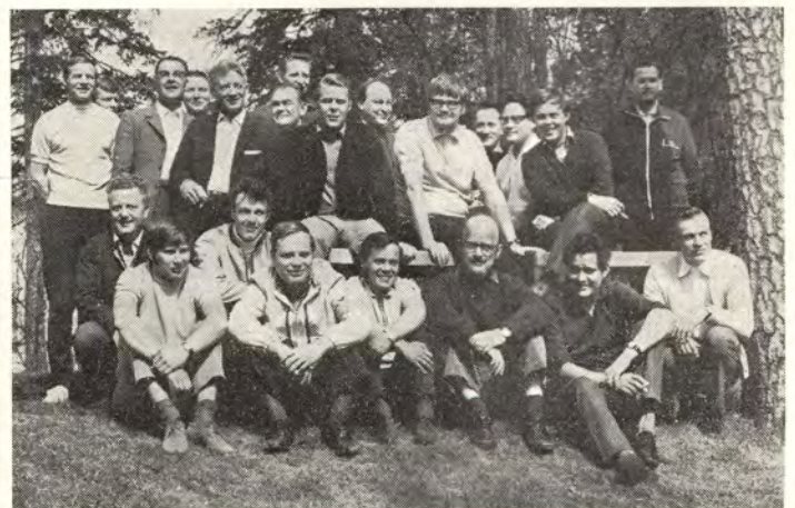
Karkkilan tehtaan insinöörejä ja työnjohtajia jatkokoulutuspäivillä Verlan lomakylässä