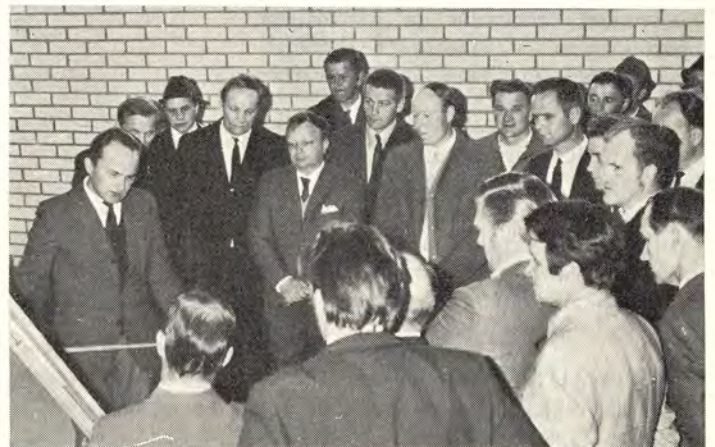
Kymin ja Voikkaan paperitehtaiden tuotantokomiteat tutustuivat myös Suomen Metallikutomon tuotantolaitokseen Juantehtaalla vierailunsa yhteydessä

AMMATTIKOULUN KOTITALOUS-OSASTON lähes kuusikymmenvuotisen toiminnan päättäjaiset pidettiin amat-