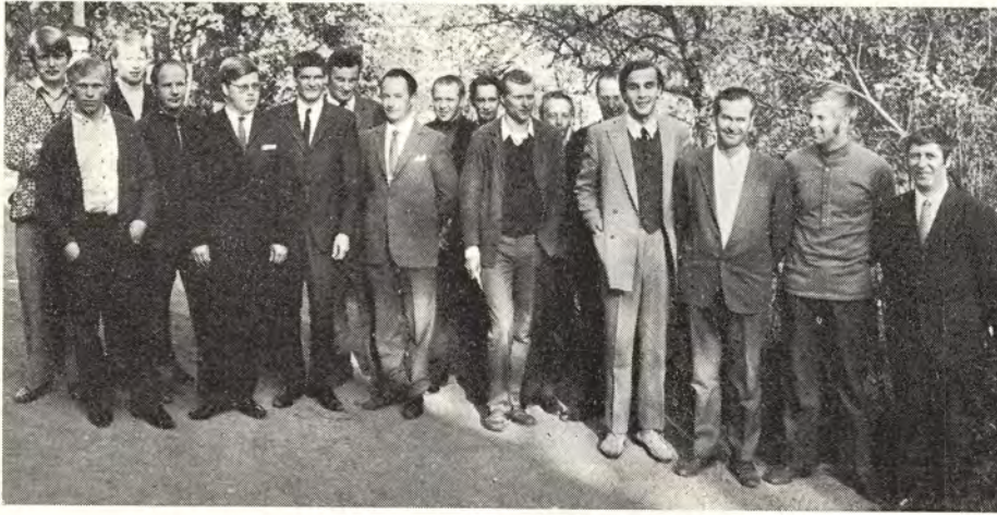
Voikkaan puuhiomon työntekijöitä työteknillisen kurssin päättäjätilaisuudessa Voikkaan mestarikerhon edustalla

AVUSTUSKASSA. Kausipalkkaan siirtymisen johdosta Kuusankosken Tehdaitten Avustuskassan hallituksen kokoukset pidetään normaalisti joka toisena tiistaina sillä viikolla, jonka perjantaina yhtiö maksaa palkat. Korvaukset ovat jäsenten nostettavissa tällöin tilinmaksun yhteydessä. Jotta korvaushakemukset ehdittäisiin käsitellä, on ne toimitettava työosastoille edelleen Avustuskassaan lähetettäväksi viimeistään viikkoa ennen hallituksen kokousta. Kesäkuun I tilitys maksetaan vanhan järjestelmän mukaisesti 7. 6. Kesäkuun II tilitys maksetaan 24. 6. (juhannusaaton aatto).