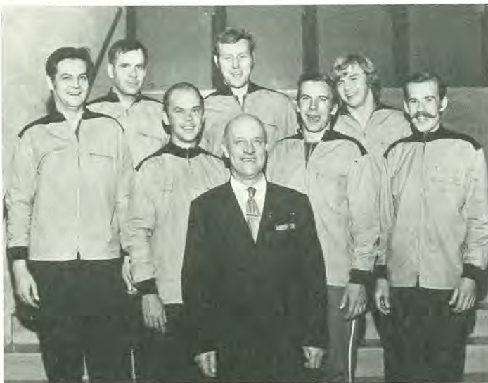
Salon tehtaan lentopallojoukkue osoitti erinomaista kuntoa yhtiön mestaruuskilpailuissa voittamalla kaikki vastustajansa

YHTIÖN KUNTOKILPAILUUN on tehty eräitä muutoksia. Kilpailu päättyy aikaisemmin ilmoitetun 15. 8. asemesta vasta 31. 8. 1972. Vastaavasti uusi kilpailu alkaa 1. 9. 1972, joten kilpailu on tulevaisuudessa vuoden pituinen. Avioparikilpailun päättymiseen nähden on myös tehty muutos ja viimeinen suorituspäivä on 26. 3. 1972.