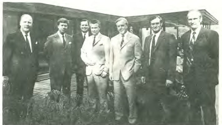
Englantilaiset paperinostajat kuvattuna isäntineen johtokunnan huvilan terassilla.

Asuntojen kokonaiskustannukset ovat n. 900 mk/m 2 . Asuntohallituksen ohjeiden mukaisesti asuntojen hinnat jyvitetään, jolloin pienien asuntojen hinnat tulevat keskimääräistä kalliimmiksi ja isojen vastaavasti halvemmiksi. Yhtiö-