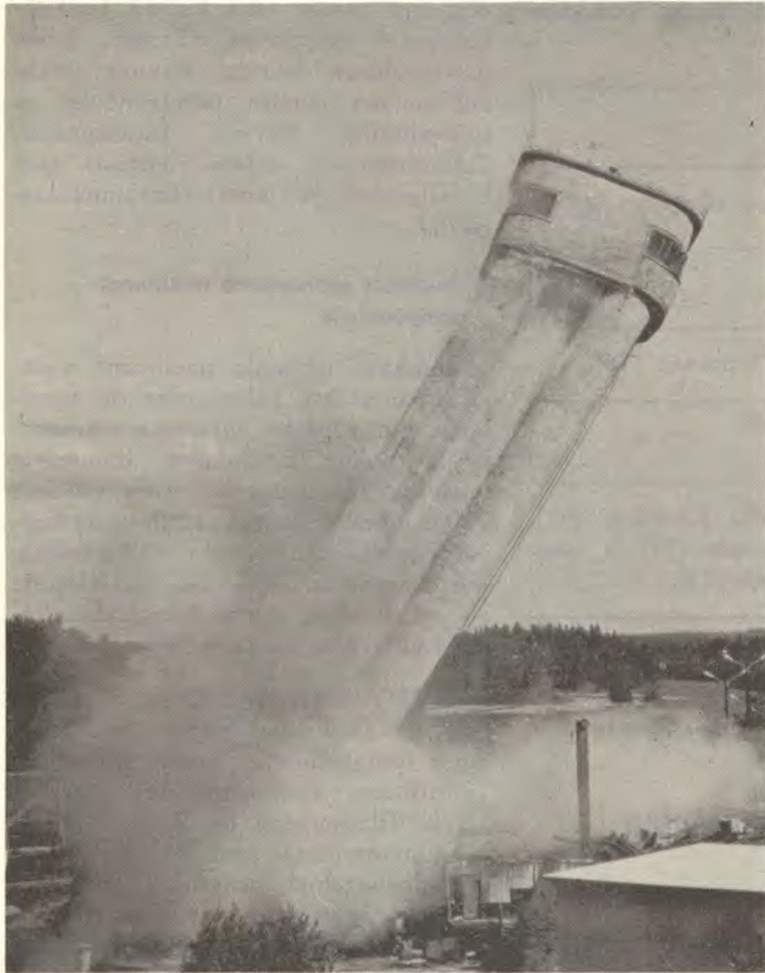
Voikkaan entisen sulfiittisellutehtaan happotorni kaadettiin elokuussa räjäyttämällä. Samalla purettiin myös muita vanhan sellutehtaan käyttämättömäksi jääneitä rakennuksia.