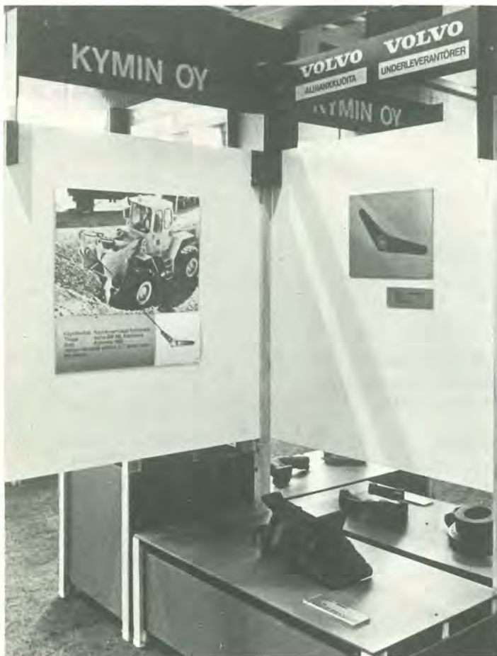
Yhtiön metalliryhmään kuuluva Högforsin valimo on Pohjoismaiden suurimman teollisuusyhtymän Volvon huomattava alihankkija. Vuonna 1973 oli Volvo valimon toiseksi suurin asiakas.

Merkittävä seikka on myös se, että Kymiyhtiön tuotteita löytyy myös niistä ajoneuvoista, jotka Volvo rakentaa Euroopassa sijaitsevien tehtaitensa lisäksi kolmessa muussakin maanosassa. Alihankkijoiden viennin myötä tulee suomalainen työ ja suomalainen laatu tunnetuksi ympäri maailmaa.