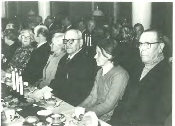
Yhtiön eläkeläisille pidettiin joulujuhlia myös Koskelassa ja Voikkaan seuratalossa, joissa oli läsnä yht. n. 1 400 eläkeläisvierasta.

Eläkeläisille järjestetyissä joulujuhli-ssa 17. ja 18.12. Koskelassa ja 19.12. Voikkaan seuratalossa oli perinteelliseen