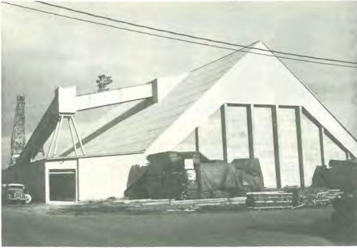
Hillon kaoliini- varastoa Haminan satamassa laajen- netaan.