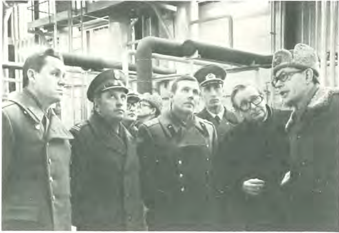
Suomessa toimivat ulkovaltojen sotilasiasiamiehet tutustuivat Kaakois-Suomeen suuntautuneella matkallaan myös yhtiön Kuusankosken tehtaisiin.