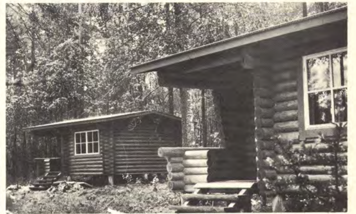
Hirsisten lomamökkien asukkaiden käytössä on oma sauna.