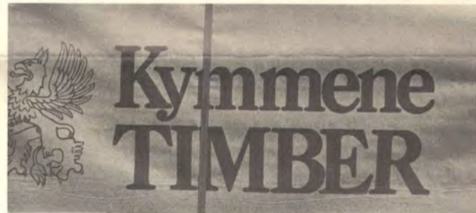
Soinlahden puuta lähdössä pakattuna maailmalle.

Tukit kuljetetaan sahalle kuorma-autoilla. Vastaanoton jälkeen tukit kuoritaan ja ne siirtyvät optisen tukkimittarin kautta lajittelijan arvioitavaksi. Sen jälkeen tukit siirtyvät johonkin