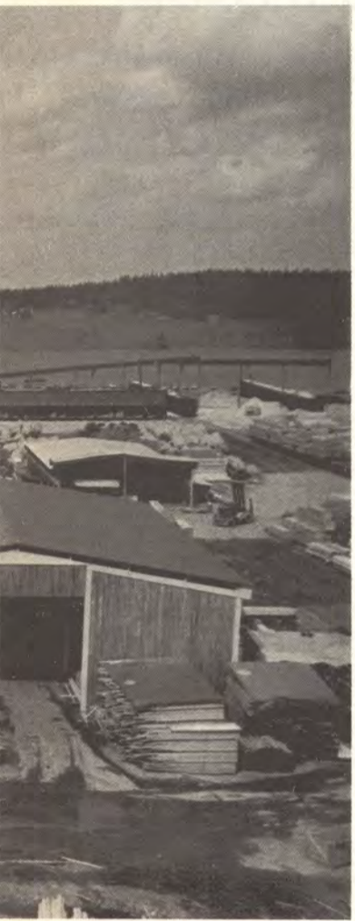
a kuvan keskellä kehäsahalinja

jälkeen sahatavara on valmis lähtemään ostajille. Kuljetus tapahtuu enimmäkseen junalla. Suurin osa vientiin menevästä tavarasta laivataan Kotkassa, Rahjassa sekä Ykspihlajassa.