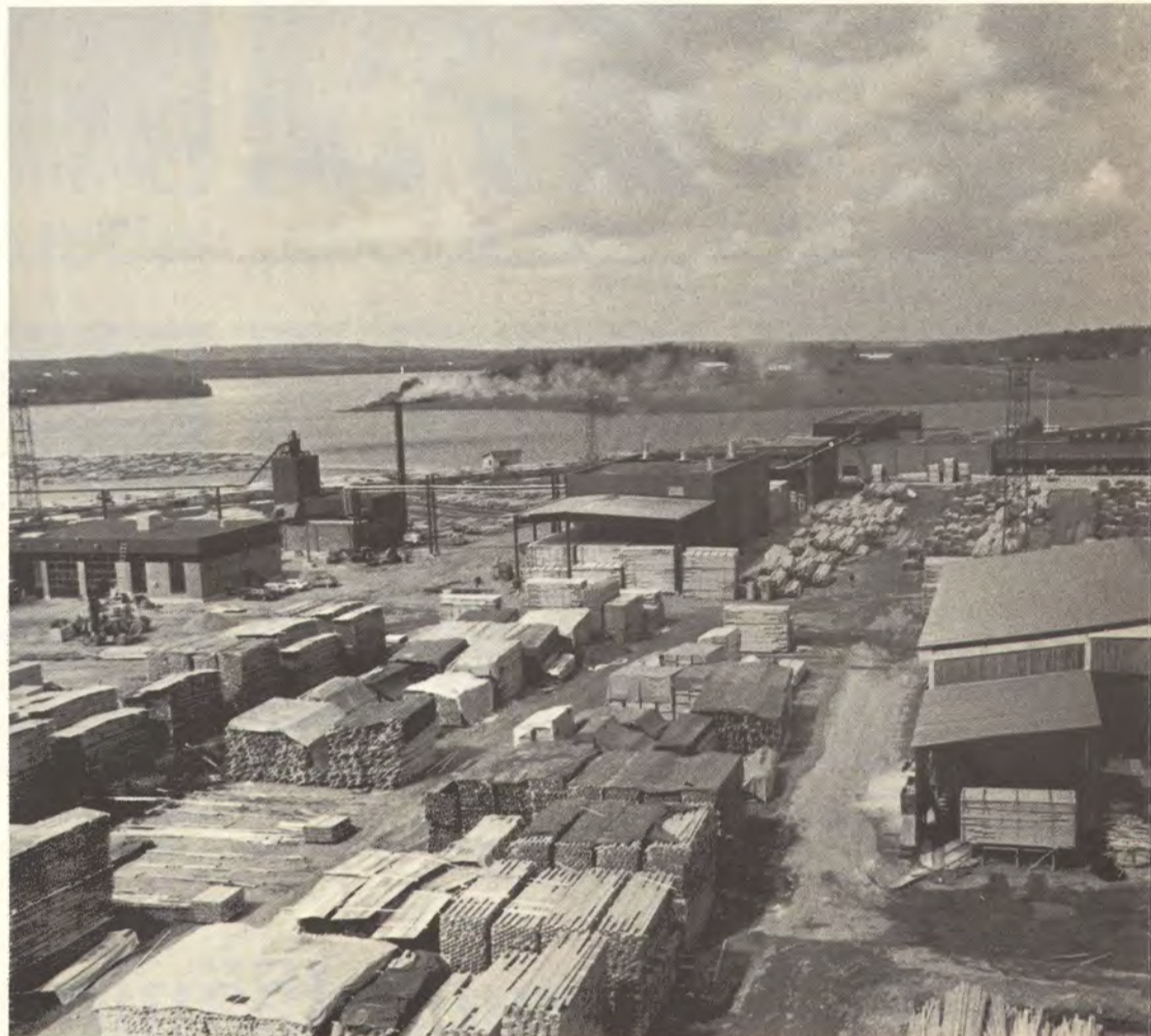
Soinlahden sahan uusi kuljetusvälinekorjaamo on kuvassa vasemmalla. Sen takana on lämpökeskus ja kuivaamoineen. Uusi pelkkahakkurilinja tulee kehäsahan lämpökeskuksen puoleiselle sivustalle.

Lähtövalmiudessa on vuorossa sahan jälkikäsitteilylaitteiston uusiminen ja jatkojalostuksen laajentaminen. Sen jälkeen on sahan kannattavuus Miettisen mu-