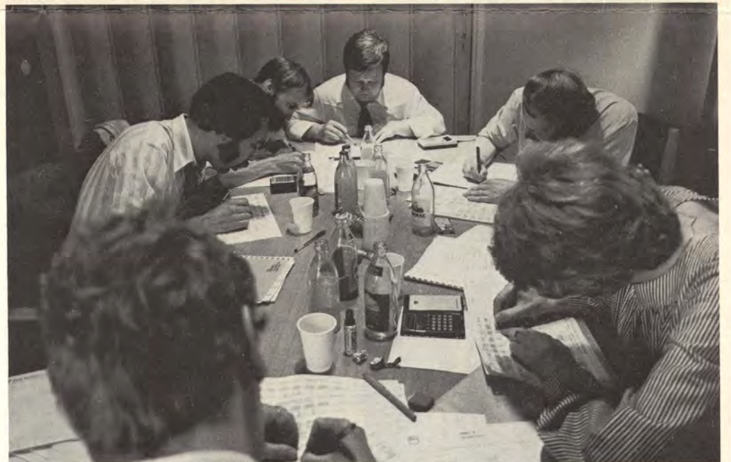
Kilpailu on alkanut. Alkutilanteeseen tutustutaan tietokoneohjelmien avulla tarkoin. Taskulaskimet piipittävät, markkeerauskyntä suhisee.

Teksti: Reijo Virta