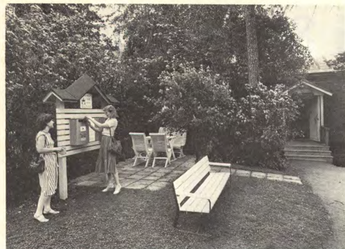
Verlan uusi postikatot on patruunan puistossa sirenipensaiden katveessa aivan Väentuvan pihapiirissä. Postimerkkiautomaatti toimii viiden markan rahalla, joita saa tarvittaessa Väentuvasta.

Viime keväänä posti- ja telehallitus myönsi Verlan tehdasmuseolle pysyvän kuvaleiman, jota käytetään 1.5.—31.9. välisenä aikana kaikissa Verlasta lähetetyissä postilähetyksissä.