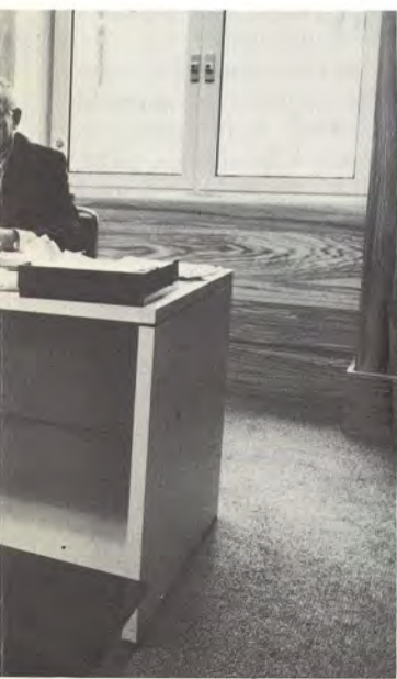
amista "omista" asiakkaistaan.