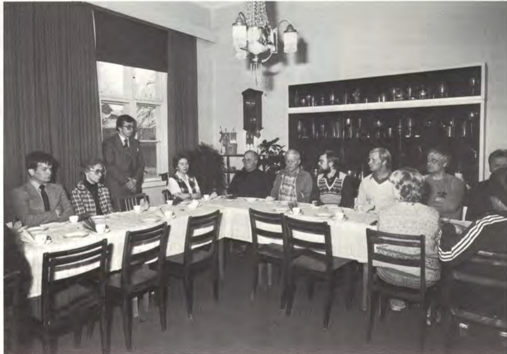
Hallassa apurahojen luovuttamistilaisuus oli kodikas ja lämminhenkinen.

Kaikkiaan 399 hakijalle myönsi yhtiön 100-vuotissäätiö tänä vuonna apurahan. Saajista 211 oli palveluksessa olevia, 47 eläkeläisiä, 98 perheenjäseniä ja 43 kerhoja ja yhteisöjä. Apurahat myönnettiin paikallisten hallintokuntien esitysten mukaisesti.