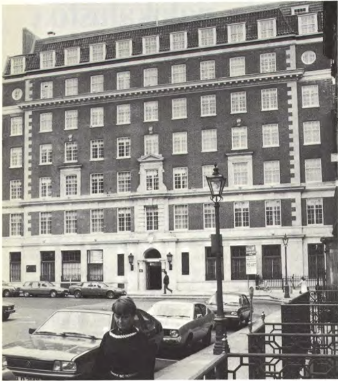
Kuvan rakennuksen toinen kerros on Kymmene Paper Limitedin käytössä.