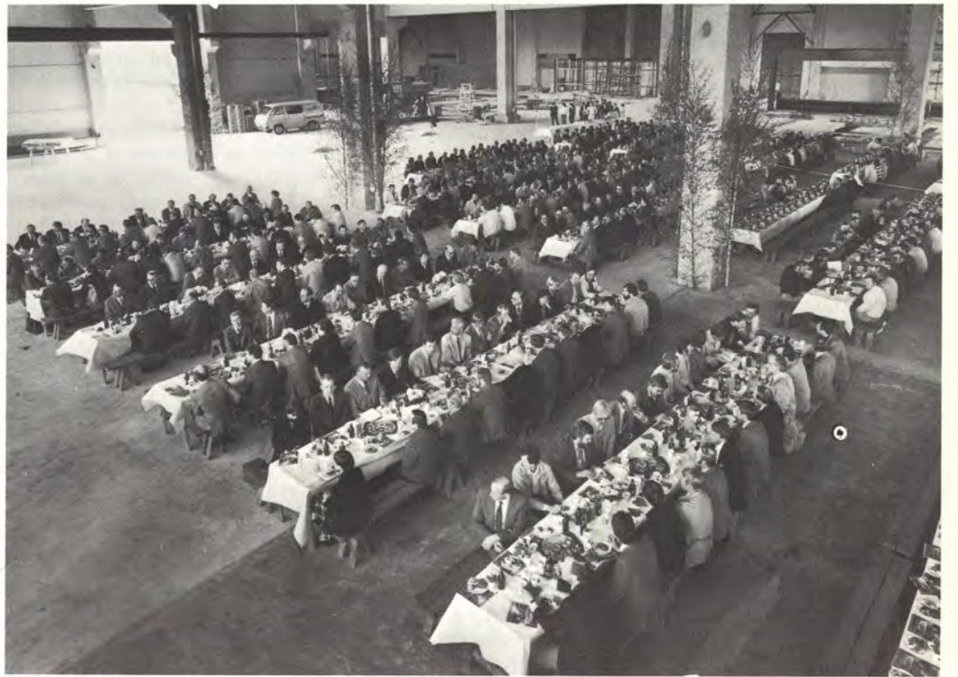
Kutsut harjannostajaisilaisuuteen oli lähetetty 700 henkilölle. Harjannostajaisjuhla oli jälkikäsitteilyhallissa.

Uuden koneen mittasuhteita kuvaa hyvin se, että