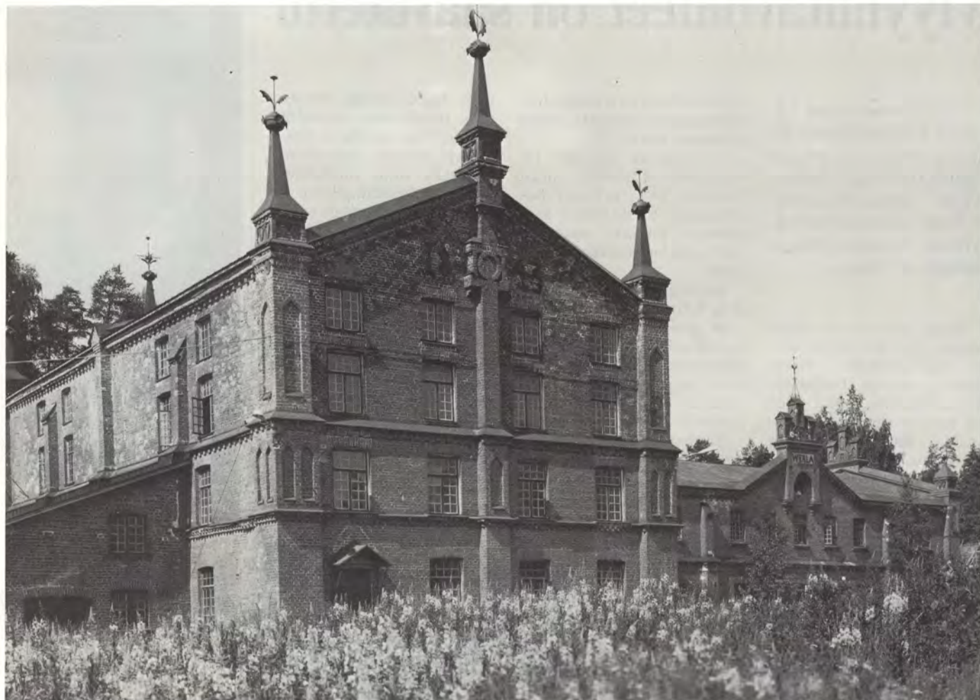
Verla on tyypillinen romanttisen tehdasarkkitehtuurin luomus. Tiilenen pahvikuivaamo (etualalla) on rakennettu vuonna 1893 ja takana näkyvä tehdasosa kaksi vuotta myöhemmin.

Kymmenen vuotta sitten avattu Verlan tehdasmuseo on nykyisin yksi Kymenlaakson suosituimmista nähtävyyksistä. Tätä metsäteollisuuden historiallista monumenttia käy vuosittain ihastelemassa n. 10 000 henkilöä. Museon ensimmäisen kymmenvuotiskauden aikana vanhaan pahvitehtaaseen ja sitä ympäröivään ruukkikylään on tutustunut runsaat 90 000 kävijää.