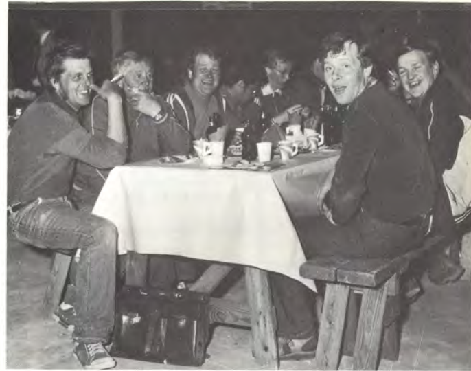
Tunnelma harjannostajaisissa oli välitön.

Julkisivumuuraus em. tiloissa vaati noin 156 000 tiiltä ja väliseinämuuraus 126 000. Kattoelementtien yhteenlaskettu ala on 1,3 hehtaaria.