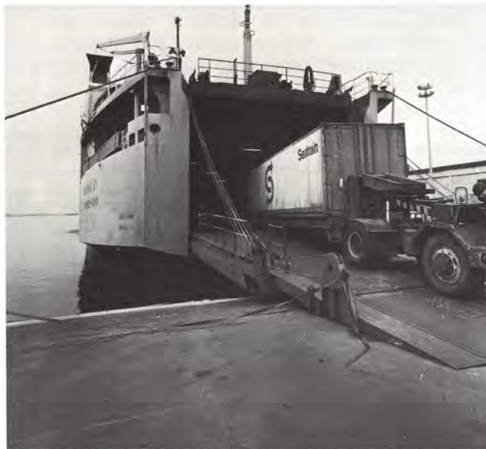
Käytettäessä roll on-roll off -lastinkäsittelytapaa tapahtuu mm paperirullien siirto vaakasuorassa, pyörien päällä.

Myyntikonttorit toteuttavat myyntisuunnitelmaa lähettämällä teleks-tilaukset tuotannosuunnitteluosastolle. Myyntisuunnitelman toteuttamisen lisäksi tuotannosuunnitteluosasto vastaa tilausten käsittelyrutiineista, syöttää tilaustiedot ATK-järjestelmään ja laatii paperikoneiden ajo-ohjelman.