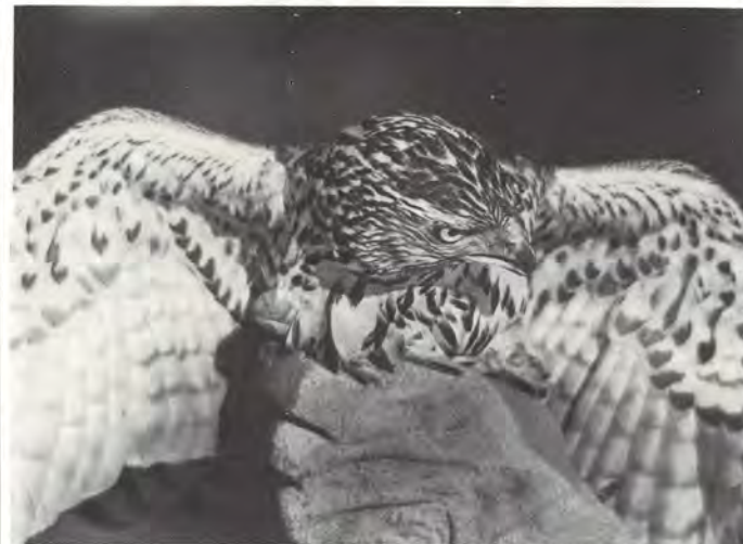
Nuori uroskanahaukka eksi helmikuun lopulla vanhan sellun tiloihin.

Kymiyhtiön vanhat tehdasrakennukset Kymen tehtaalla ja Voikkaalla ovat paikoitellen epäkäyttännölliset nykyisen suuruiseen tuotannolliseen toimintaan. Sitä miellyttävämpiä vanhat osat tehtaista ovat sen sijaan paikalliselle pikkulintukanalle, erityisesti puluille.