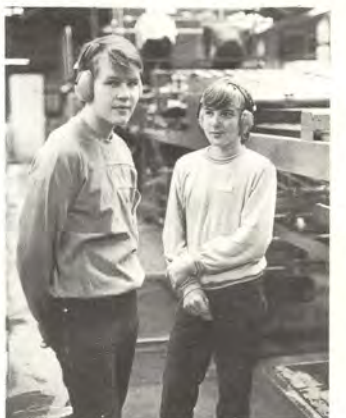
Pojat tutustuivat mm. arkkisaliin.

Yli 50 kuusankoskelaista yläasteiden yhdeksänsien luokkien oppilasta on kahden viimeksi kuluneen viikon aikana tutustunut työelämään Kymillä Kuusankoskella.