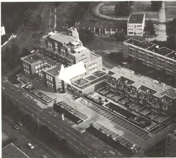
Kymmene Paperin konttori sijaitsee vain kahden kilometrin päässä Hannoverin keskustasta.

Kun maanviljelijä myy puuta teollisuudelle, kiinnittää hän hinnan lisäksi erityistä huomiota korjuunjälkeen. Kymin puunhankkijoihin ollaan tyytyväisiä Iitin-Kuusankosken metsänhoitoyhdistyksessä. Sivulla 4.