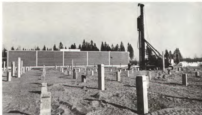
Työmaalla on parhaillaan menossa paalutustyöt.