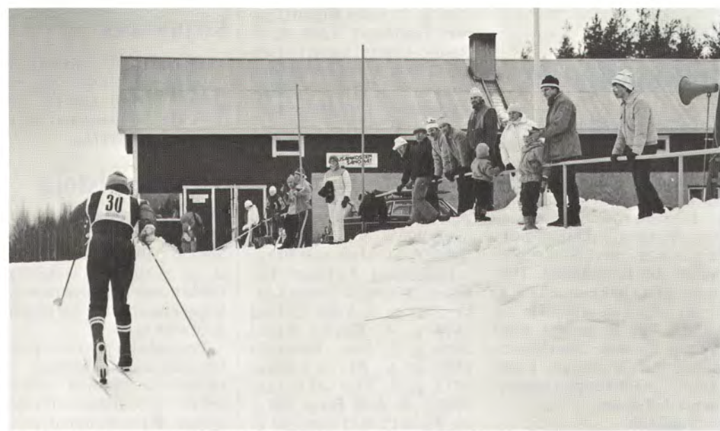
Huutosakki kannusti kilpailijoita Kuntotöyrän pihamaalla Pilkanmaassa.

Kilpailuolosuhteet Kuntotöyrässä olivat mainiot ja keli erinomainen. Luisteluhiihto sai näissä kisoissa odottaa vielä vuoroaan, nyt kilpailtiin perinteisellä hiih-