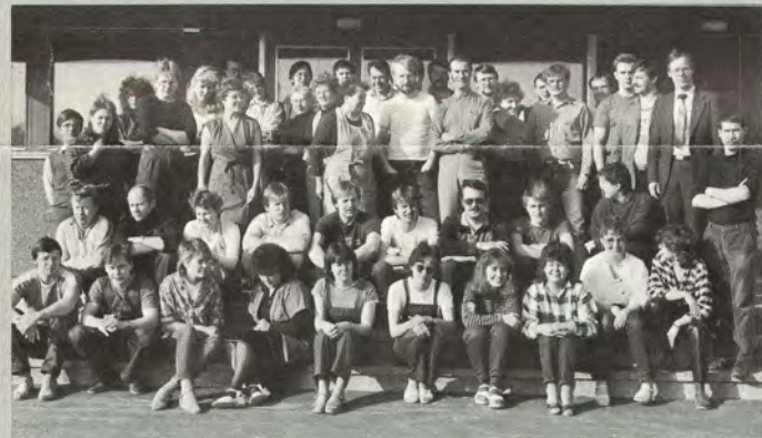
Kirjapainon päivä- ja iltavuorolaiset juhlakuvassa.

Apurahat jaetaan touku- kuun puolivälin aikoihin pidettävässä tilaisuudessa.