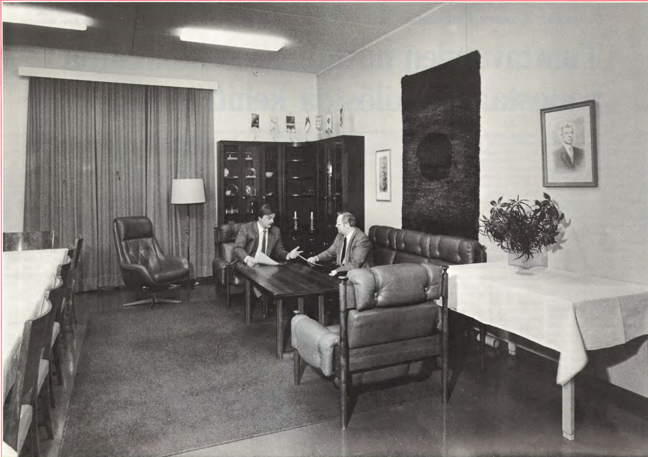
Voikkaan mestarikerhon vanhassa, mutta hyväkuntoisessa rakennuksessa on tunnelmaa.