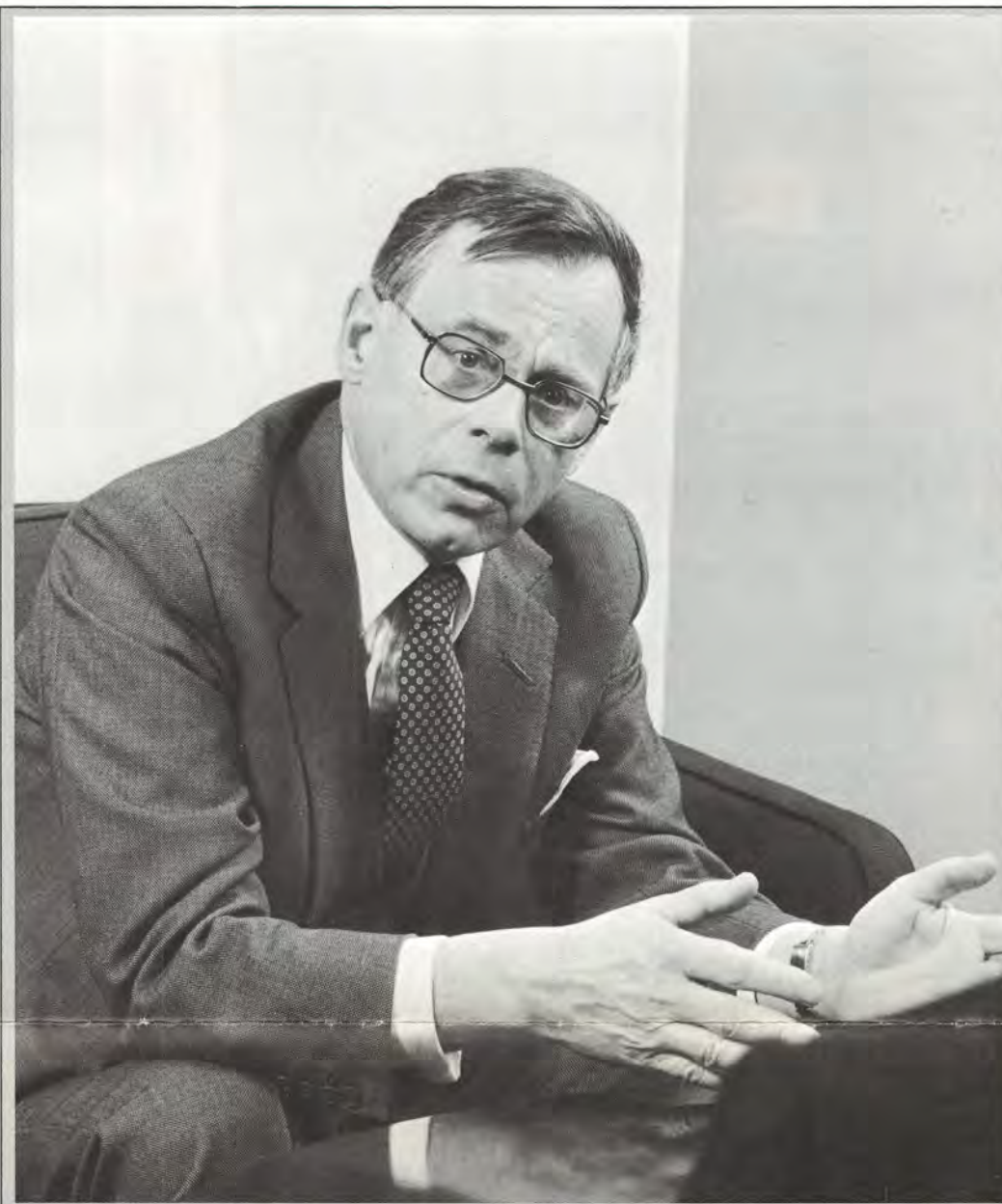
Pääjohtaja Casimir Ehrnrooth

Vaikka henkilöstöpolitiikan kehittämisessä kuluukin runsaasti "jos ei tupakkaa, niin ainakin kahvia", uskoo Ehrnrooth tuloksena olevan tasapuolisen ja hyvän ratkaisun. Yhdenmukaisuuteen ei pyritä toisella puolella