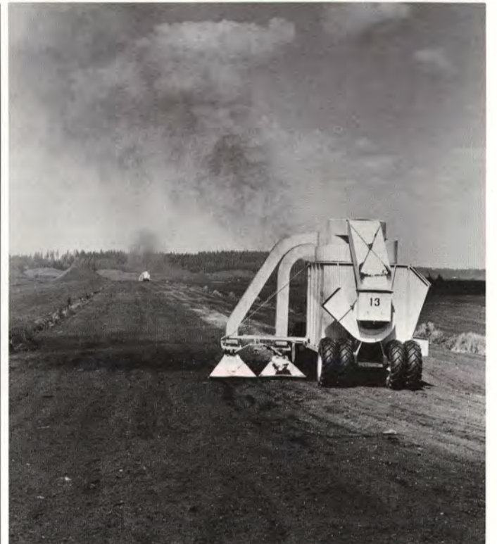
Turpeennosto lopetettiin Haukkasuolla elokuun 1. päivänä.

AKT:n liittotoimikunta oli koolla 1.8. ja ilmoitti saaneensa mm. Kymi-Strömbergin selvityksen Etelä-Afrikan kaupasta. Selvityksen johdosta liittotoimikunta pidättäytyi lisäboikoteista, jotka olisivat vaikuttaneet yhtiön koko ulkomaankauppaan.