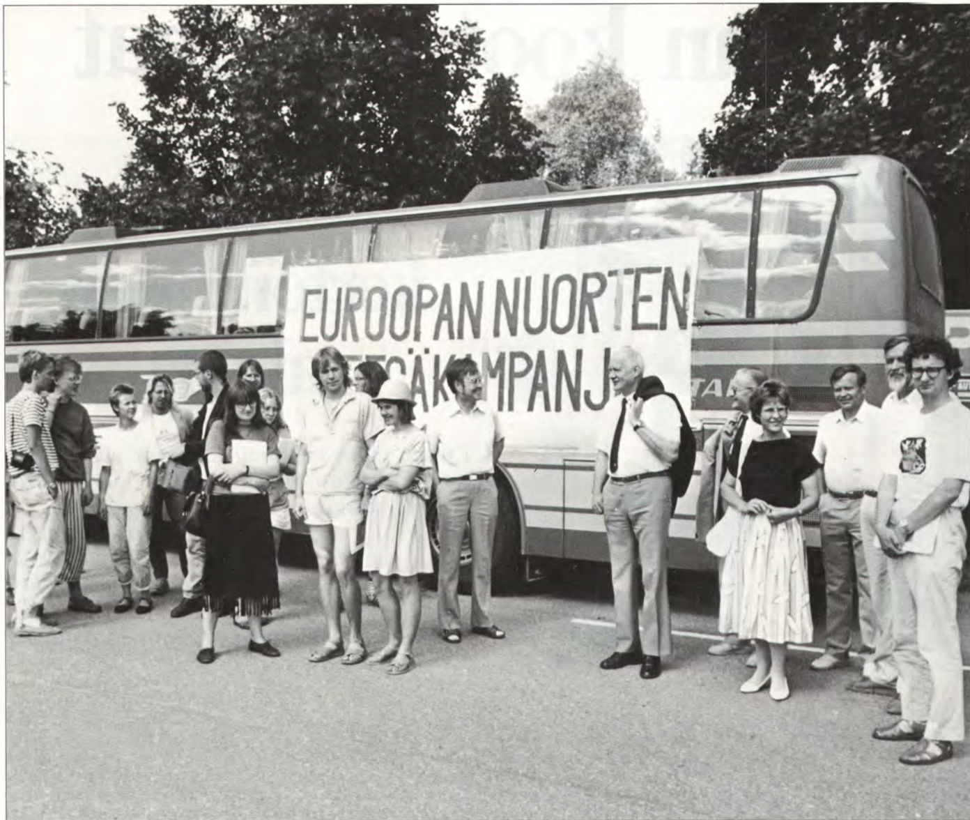
Bussilastillinen Euroopan Nuorten Metsäkampanjan metsäviestin osanottajia saapui tutustumaan Kymiin.

teet ovat lipeisiä, systeimi heittää automaattisesti venttiilit toiseen asentoon ja vedet alkavat tulla varasäiliöön", kertoi Lindberg tehdaskierroksella.