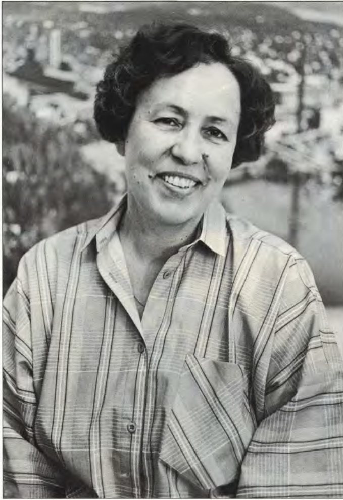
Monitoimisen Marjatan tuntevat useimmat etunimeltä.

"Tärkeimpiä tehtäviäni on 100-vuotissäätiö, ainakin omasta mielestäni", sanoo säätiön Kuusankosken hallintokunnan sihteeri. "Olen ollut ihan alusta lähtien sää-