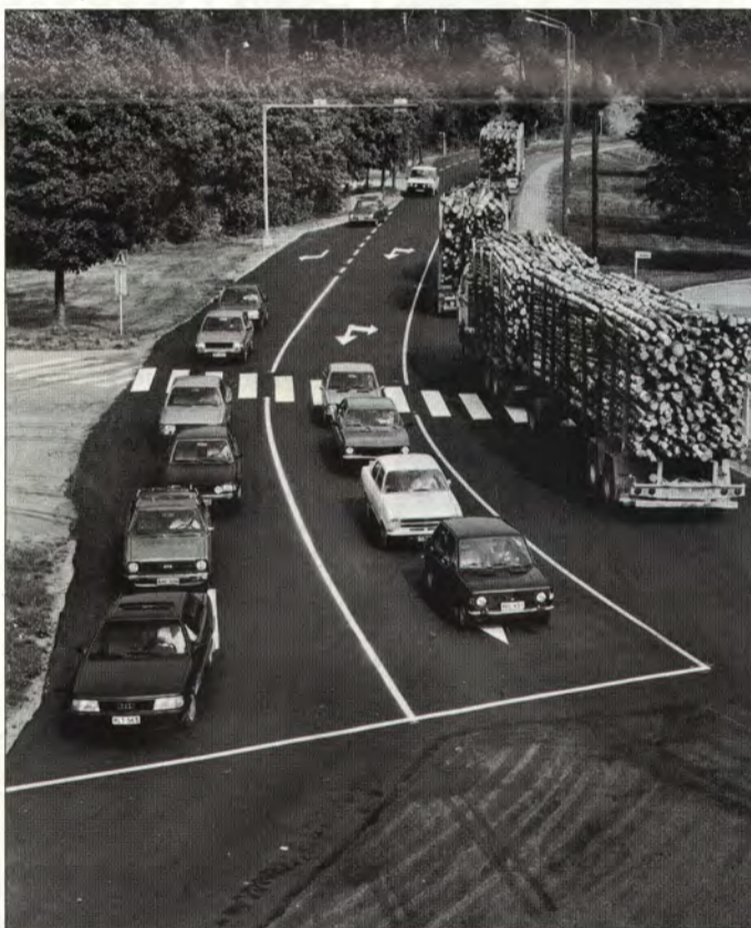
Työmatkakyselystä selviää, että suurin osa yhtiöläisistä kulkee työmatkansa joko henkilöautolla tai polkupyörällä.

Toiseksi pahimmaksi kohdaksi vastanneet katsoivat Valtakadun ja Ekholmintien risteuksen Kuusankosken