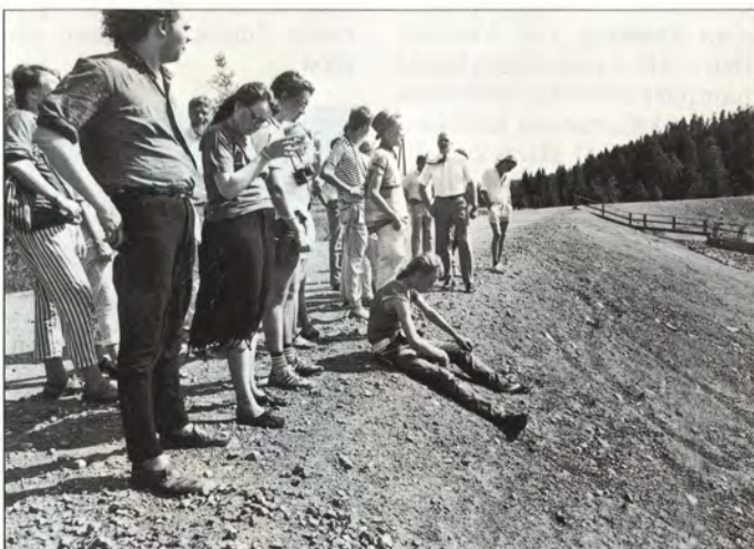
Kierrokseen sisältyi myös pistäytyminen sellutehtaan suoja-alla.

"Pitäisi löytyä selvä ohjelma, jonka hyväksyisivät ympäristönsuojelijat, teollisuus ja viranomaiset, jotta voisi olla varma siitä, mitä pitää tehdä."