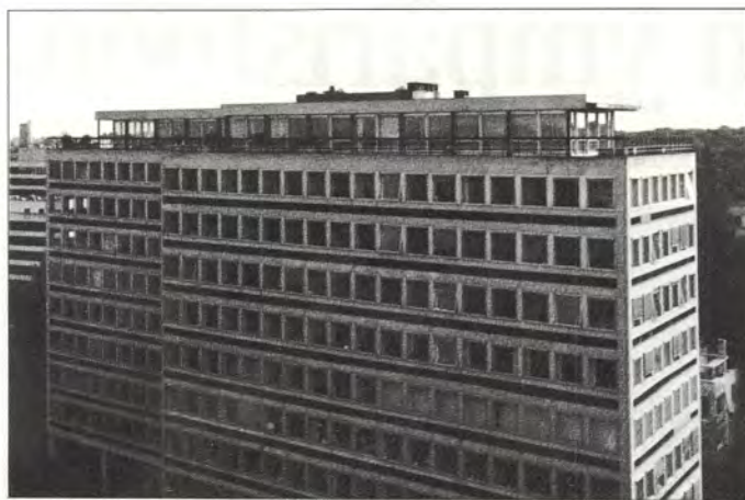
S.A. Kymmene-Star, Benelux N.V. -konttori sijaitsee brysseliläisen tornitalon kattotasanteella.

KSB markkinoi 2/3 paperista Belgiaan, 1/3 Alankomaihin ja hyvin pienen määrän Luxemburgiin. Vuon-