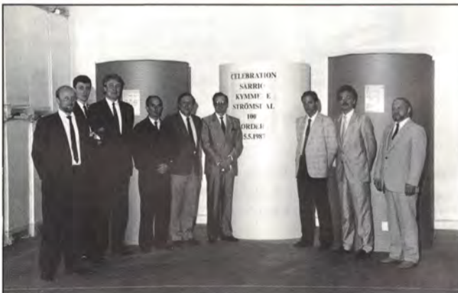
Vieraat, isännät ja juhlarullat.

laatukysymyksiin. Teemapäivän jälkipuoliskolla käsitellään tuotantoon liittyviä seikkoja ja kunnossapitoa sekä yhteistyötä tuotteen tekemisessä. Yt-asioita pohditaan ennen paneelia, jonka aihe on henkilöstöryhmiä osuus yhteistyön tekemisessä sekä suorituskyvyn kehittämisenä.