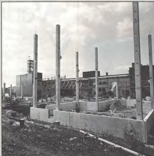
Peroksiditehtaan laajennuksen rakennustyöt saadaan pääosin valmiiksi vuoden loppuun mennessä.

Harjannostajaisien kohteena olevat rakennustyöt käynnistyivät 9. helmikuuta ja ne saadaan pääosin valmiiksi vuoden loppuun men-