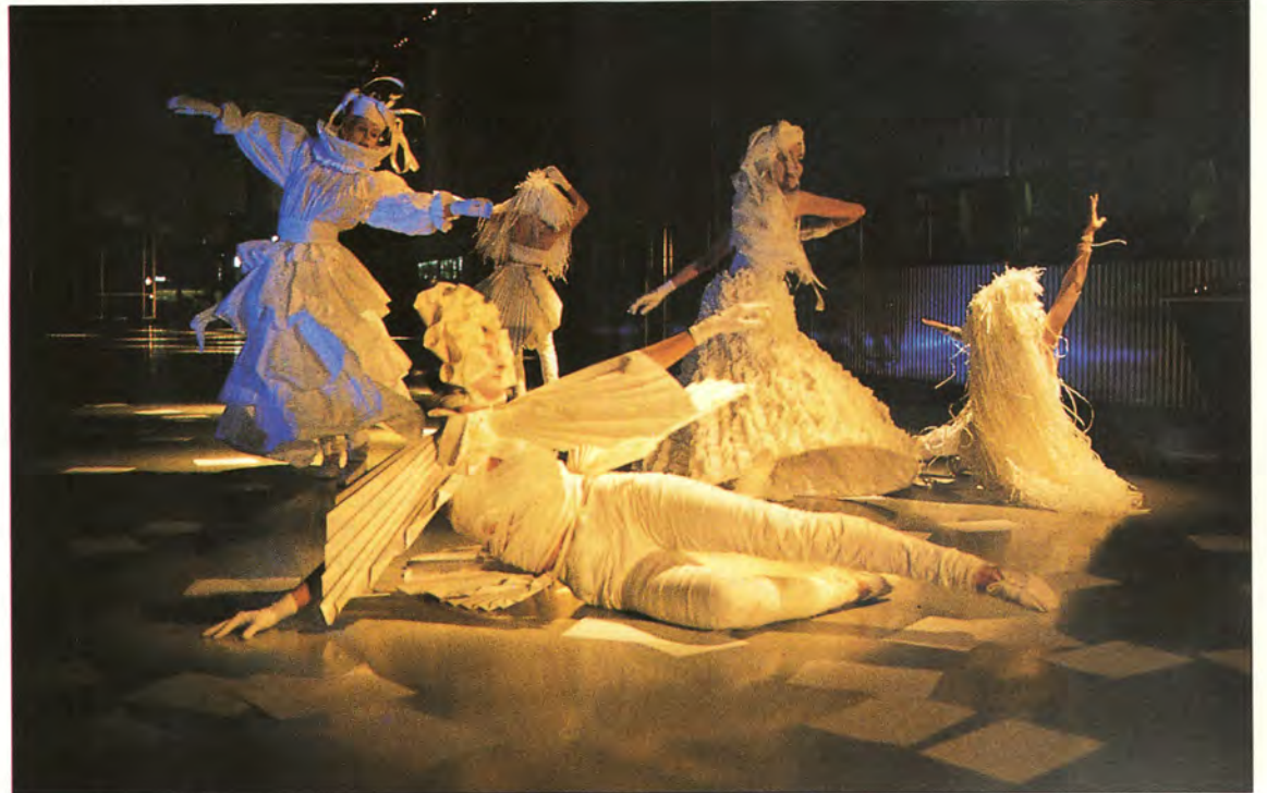
Koreografi-ohjaaja Jorma Uotinen tanssiryhmineen oli toteuttamassa uutta videota.