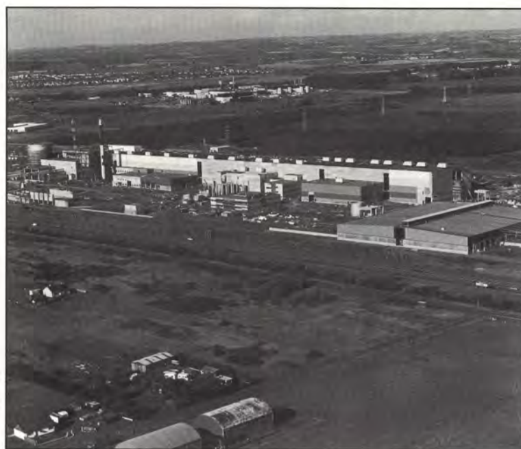
Skotlannin länsirannikolla sijaitseva tuotantolaitos aloittaa tuotannon huhtikuussa.

Uusinnan toimittaa Oy Tampella Ab Kattilatoimisto. Investoinnin kustannukset ovat 18 miljoonaa markkaa.