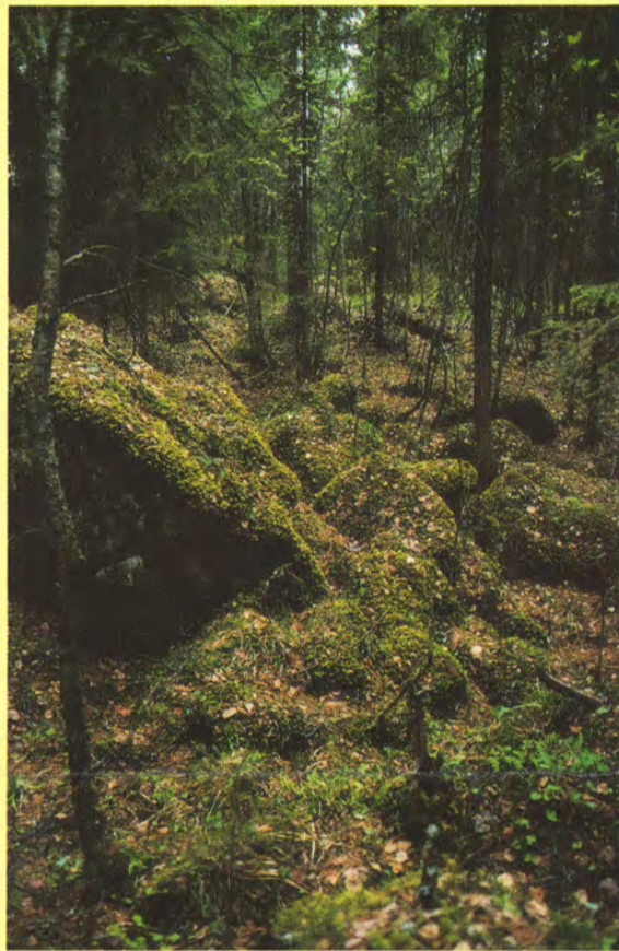
Vaiveakukuiset paikat soveltuvat luonnostaan suojeltaviksi.