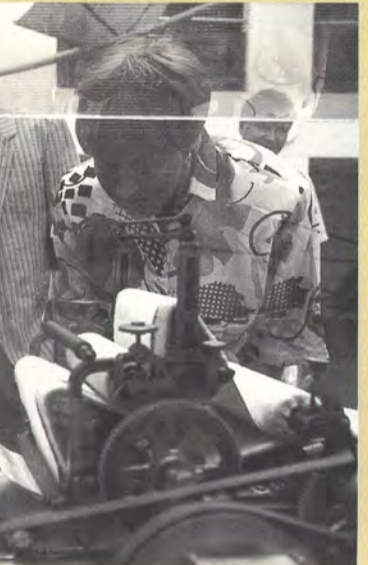
Henkilöntuon paperikoneen pienoisleikkeitä käytetty 80-luvun alun jälkeen, uluu liikaa.

työkumppaneina. Yhteistyö jatkuu paperin ostavalle asiakkaalle asti. Tärkeimpinä kilpailuvalteinaan he pitivät laatua, nopeutta, hyvää palvelua ja luotettavuutta.