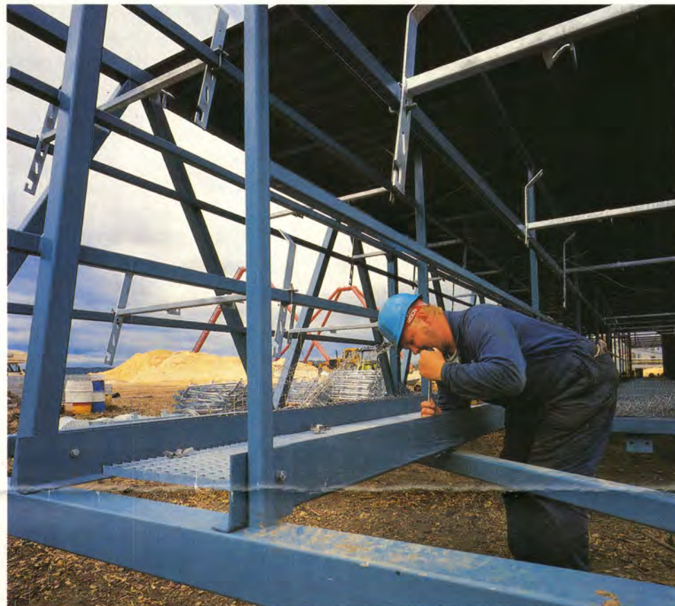
Ensimmäistä kuljetinsiltaa varusteltiin Kuusanniemessä ennen juhannusta.

Hakekasojen päällä sijaitsevien jakokuljettimien tukijalkoihin kiinnitettyjen alas-