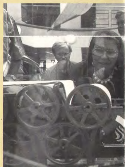
Proost en Brandtin aulassa herätti mielenkiinto. Malli on toimiva, mutta sitä ei käytetä, koska se on valmistettu kuparista ja k...

Paperiteollisuuden merkitys Saksan kansantalouden kannalta on huomattavasti vähäisempi kuin Suomessa. Koko teollisuudenala työllistää noin 50 000 henkilöä, kun BASF:llä Ludwigshafenissa tai Bayerilla Leverkusenessä on saman verran työntekijöitä yhdellä tehdas-