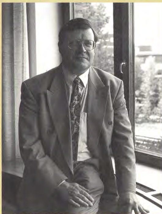
Yksinään toimivan tehtaan on Lahdelman mukaan vaikea ylläpitää riittävän laajaa tuotevalikoimaa.

Kymillä hän aloitti yritysuunnittelupäällikkönä vuonna 1972. 70-luvun puolivälistä vuoteen 1982