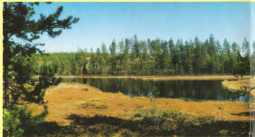
Lampi on laskettu vuosia sitten, mutta sen ei uskota vaikuttaneen alueen luon

Tuhoja voidaan Schulmanin mukaan estää kasvattamalla koivuja riittävän tiheässä ja välttämällä