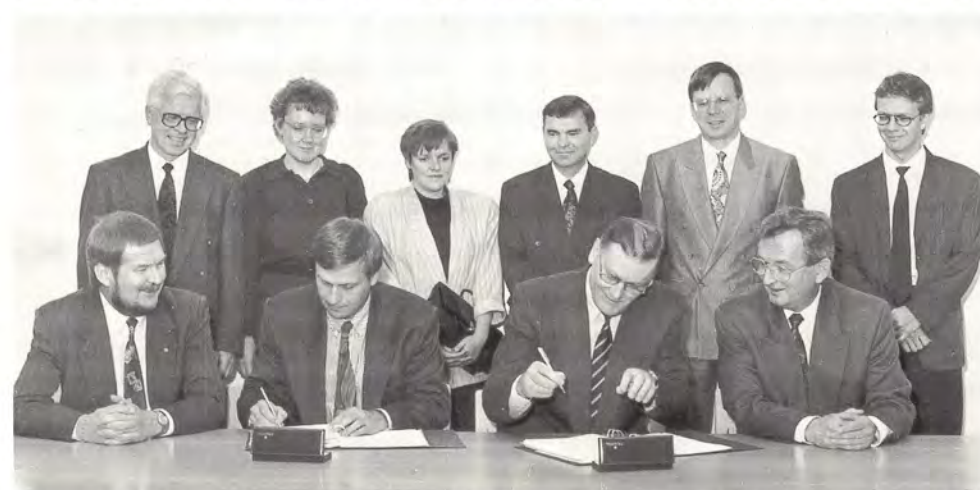
Laava-järjestelmän sovellusohjelmiston toimitussopimus allekirjoitettiin Kuusankoskella 14. lokakuuta. Toimittaja on Carelcomp Oy.

nan ja kilpailijoiden laadun seurannan sekä päästöjen, prosessin, varusteiden, mittalaitteiden ja asiakaspalautteen valvontaa.