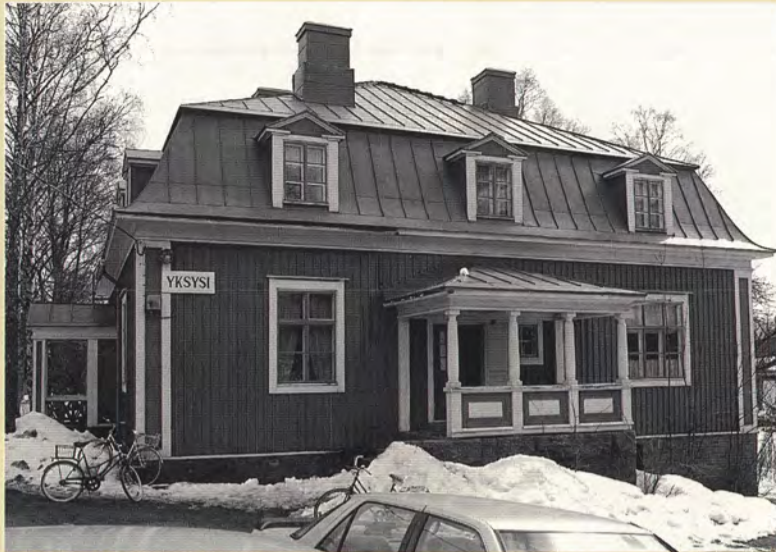
Yksysi on valmistunut vuonna 1920 ja se kuuluu Niementien suojelutaloihin.

Kyseisenä vuonna perustettiin työsuojeluvalluutetun virka samalla kun päälähtömiehen toimistotilat havaittiin ahtaiksi. Osaston edustajien ja yhtiön johdon välillä käytiin pitkään keskusteluja asian ratkaisemiseksi. Vihdoin yhtiö päätti luovuttaa omistamansa vanhan lastenseimen talon toimistoiksi. Toimistot sijoitettiin yläkertaan ja muu osa taloa annettiin ammattiosaston kokoustiloiksi.