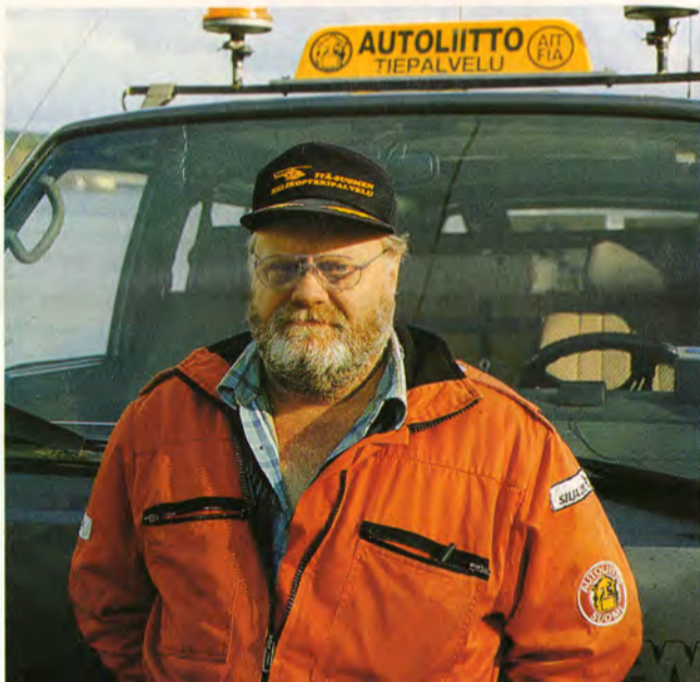
KUVA: KEIJO KOIVULA

- Sitä on anottava Autoliitolta. Tiepalveluun kuuluvilla pitää olla voimassa oleva ensiapukoulutus, pakolliset ja minimi ovat EA1 ja EA2. Lisäksi vaaditaan jonkinlaista autotekniikan tunteista sekä mielenkiintoa tehtävää kohtaan. Tunkua tähän ei ainakaan meidän alueellamme ole.