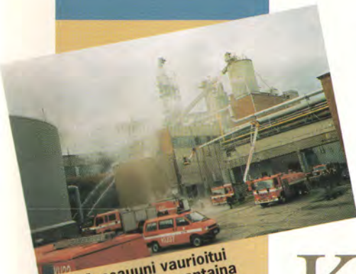
Meesauuni vaurioitui tulipalossa lauantaina 21. lokakuuta.

Kymin Paperiteollisuus Oy:n julkaisu 55. vuosikerta