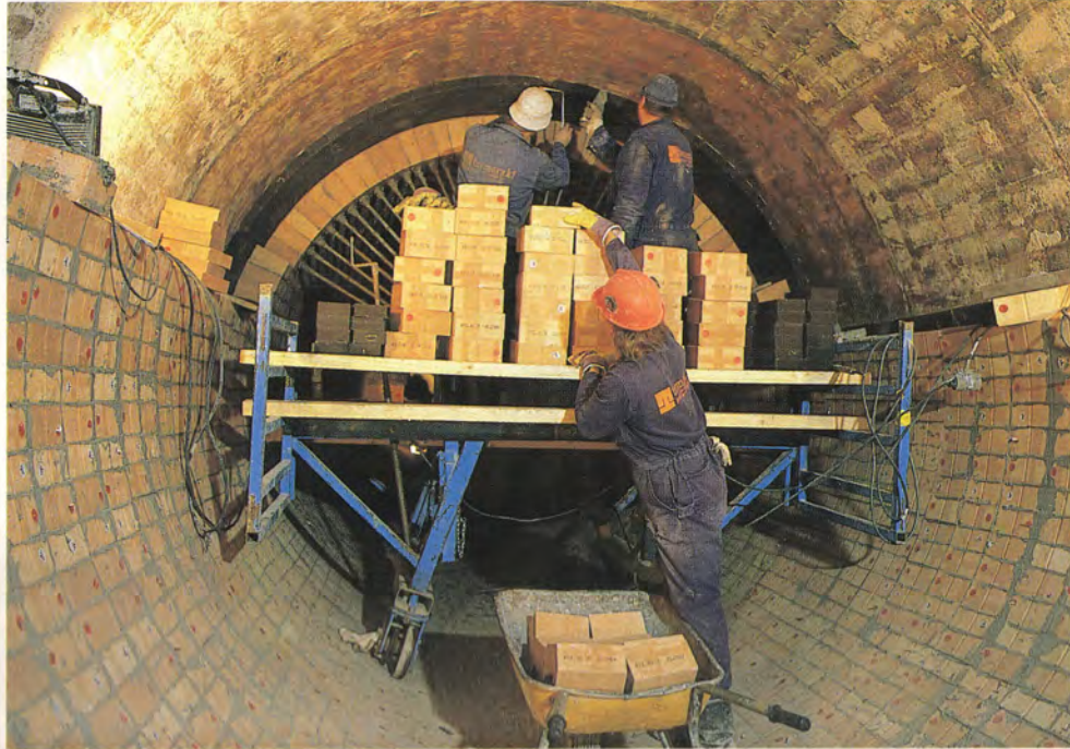
Meesauunin sisäpuolista muurausta uusittiin noin 10 metrin matkalta. Vauriokohdasta vuoraus korjattiin tulenkestävällä valulla.

Kymiyhtiö rakensi alunperin Ahlmannintien helpottamaan Kouvolan ja Kymintehtaan välistä liikennettä. Parin viime vuoden aikana Kuusankosken kaupunki ovat tehneet tiellä merkittäviä perusparannuksia. Sivu 2.