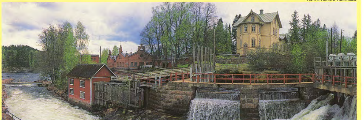
Verlan tehdasmuseoalue on ainutlaatuinen metsäteollisuuden muistomerkki.

O petusministeriö on syyskuun lopulla tehnyt virallisen esityksen Unescolle Verlan vanhan tehdaskokonaisuuden liittämistä maailmanperintöluetteloon. Aiemmin Verla oli vuodesta 1990 lähtien ns. ehdokaslistalla kyseiseen luetteloon.