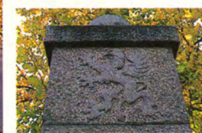
Vanhat reviiiripylväät ovat siirtyneet Ahlmannintien alkupäätä johtokunnan huvilan portinpylväiksi.