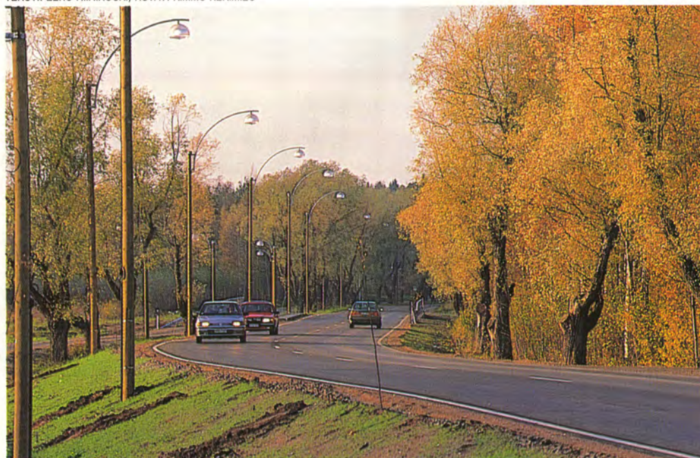
Ahlmannintie on komistunut entisestään: yli 60-vuotiaiden hopeapajujen rinnalle on tullut pyörätie ja kaunis valaisinrivistö.

TEKSTI: EERO NIINIKOSKI