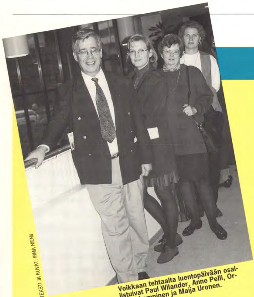
TEKSTI JA KUVAT: IRMA NIEMI