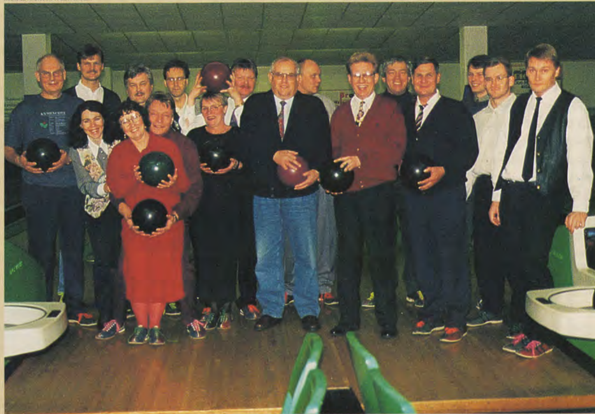
Arkkisalilaisien arkkien kehitysryhmä, yhteensä 13 henkilöä, vieraili Nordland Papierin tehtaalla Saksassa. Ensimmäisenä iltana isännät olivat järjestäneet iltaohjelmaa keilahallissa.

“Taidamme kulkea pari piirua edellä sisaryhtiöstä”