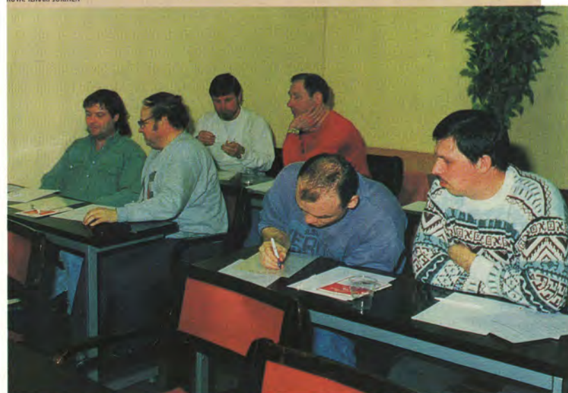
Osasto 19:n viestintäkursseille opetettiin mm. tiedotuksen perusteoriaa, tiedotteiden ja ilmoitusten laadintaa. Pääpaino oli käytännön harjoittelussa.