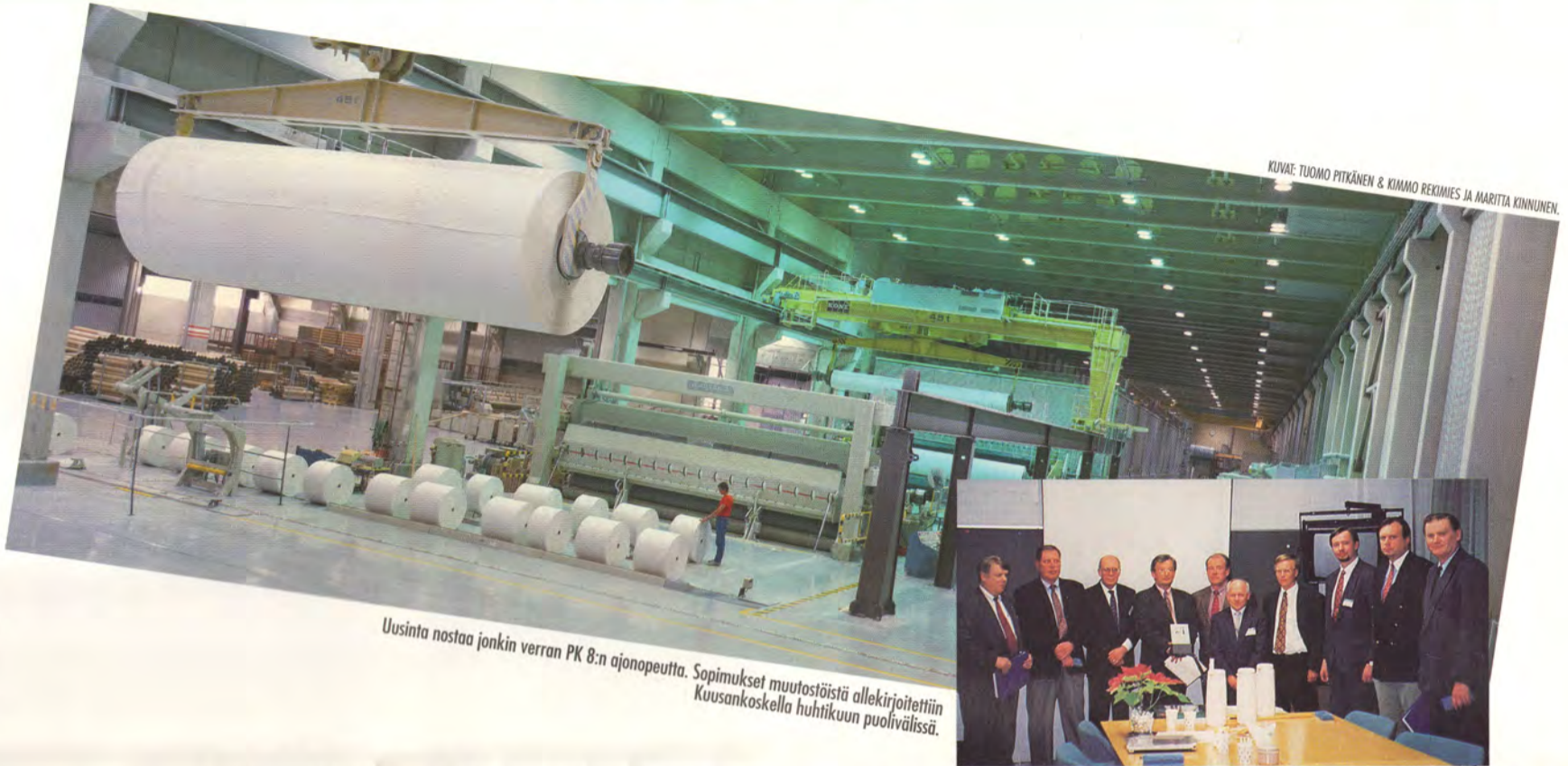
Uusinta nostaa jonkin verran PK 8:n ajonopeutta. Sopimukset muutostöistä allekirjoitettiin Kuusankoskella huhtikuun puolivälissä.