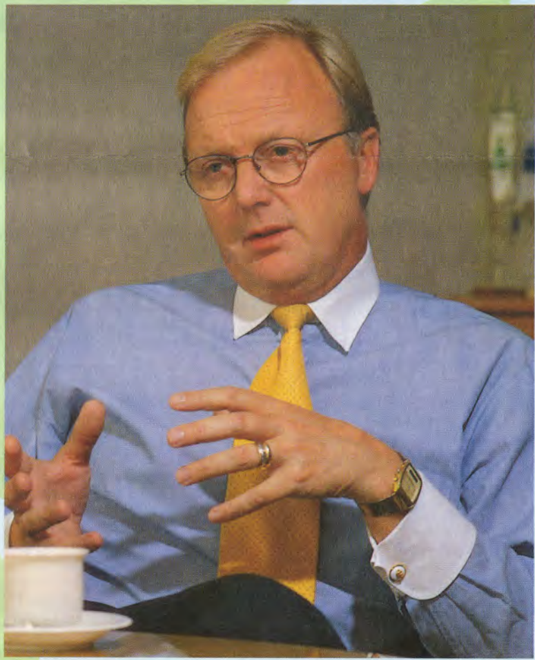
“Olemme tulossa yritystoiminnan harmaaseen arkipäivään ja vaiheeseen, jolloin todella mitataan asemamme kilpailussa”, Granholm ennustaa.