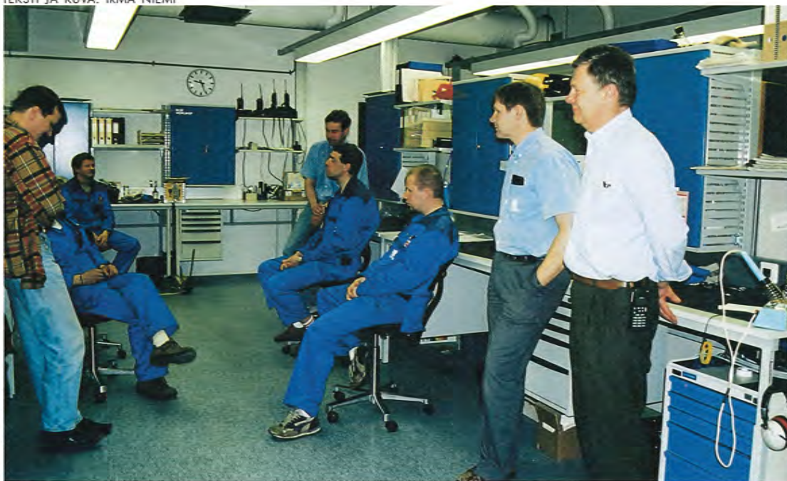
Myös asentajat varsin tyytyväisiä uuteen valoisaan korjaamoon. "Tilat ovat nyt siistit ja asialliset, mutta aika näyttää niiden toimivuuden", miehet tuumivat.