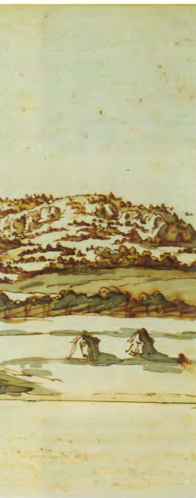
Kirjan harvinaisin kuva on sotamarsalkka Augustin Ehrensvärdin v. 1747 tekemä tussilaveeraus.

roksena, mutta kirjan toimitus jäljitti alkuperäisen kuvan Ruotsin sota-arkistosta, jolloin todettiin, että kysymyksessä onkin kahdella eri värillä tehty taidokas tussilaveeraus. Maalauksessa ovat hyvin tunnistettavissa Kuusankosken nykyiselle keskustalle tunnusomaiset kukkulat Kettumäki ja Sairaalanmäki.