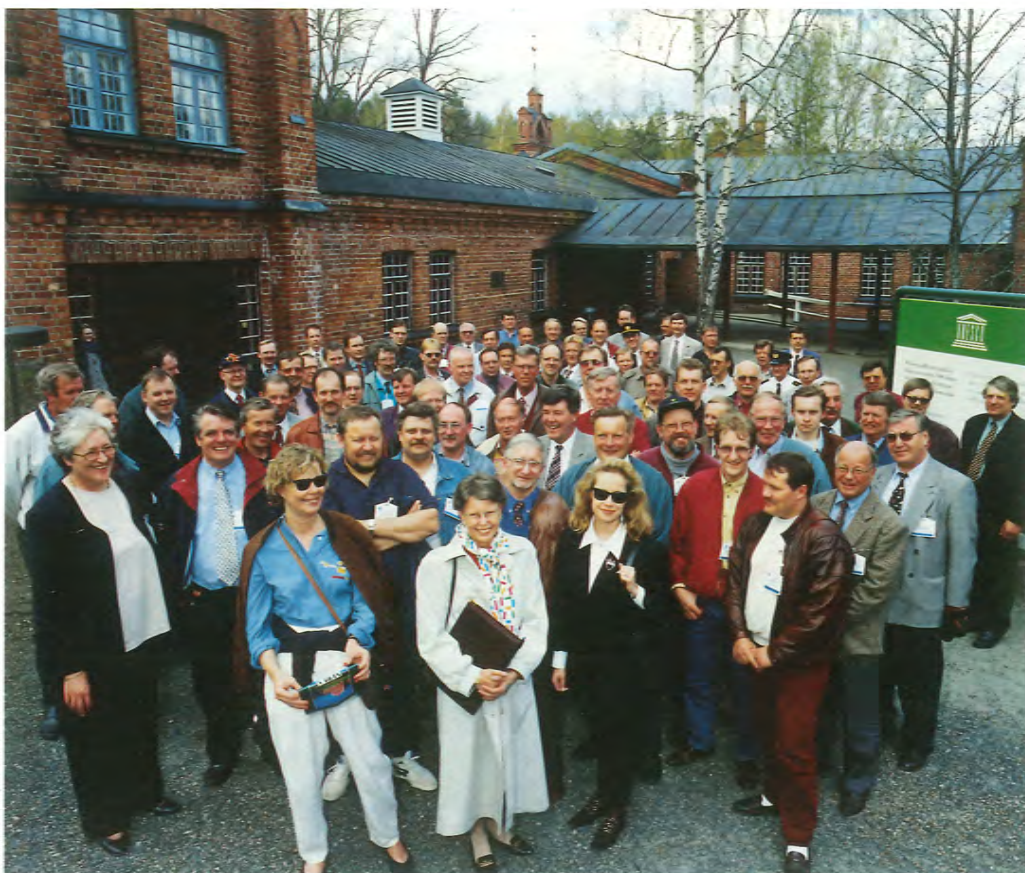
Teollisuuspalopäälliköiden opinto- ja neuvottelupäivän osanottajia Verlan tehdasmuseon pihalla