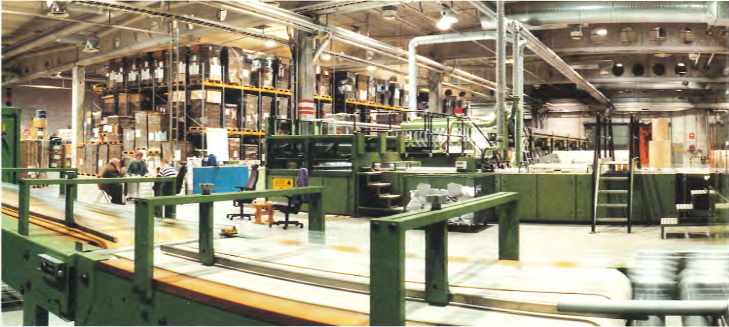
Vuonna 1996 alkaneella arkkisalin kehittämisprojektilla pyritään nostamaan salin tuottavuutta, lisäämään työihtiyyttä ja kahta.