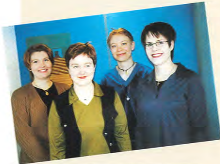
TEKSTI JA KUVAT: IRMA NIEMI

Lappalan saunamajoja voi kysellä kesäkaudeksi 4.5. alkaen, puh. 0204 15 2294.