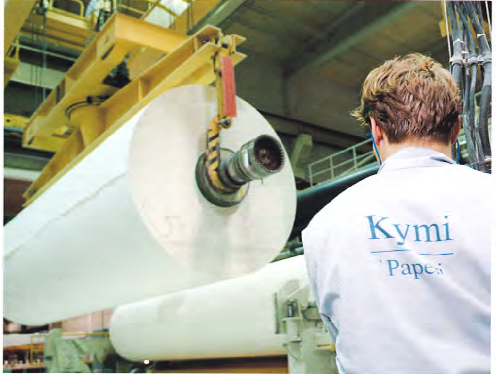
PK 8 teki uudet vuorokausituotantoennätykset sekä tammi- että helmikuussa.