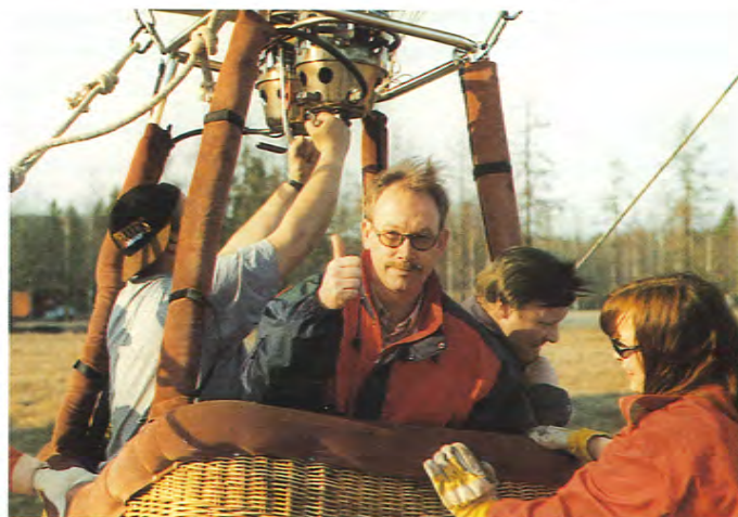
Kuusankoskeen tutustuttiin myös lintuperspektiivistä.

seen ja paperikoneisiin, kustannuslaskentaan, Kymin tietojärjestelmiin sekä myyntisihteereihin.