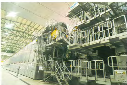
APRILIN ensimmäinen hienopaperikone käynnistyi huhtikuussa.

Auditoinnissa esiin tulleet ympäristöasiat ovat toimintasuunnitelmassa keskeisiä. Kaikilla osaluoteilla tehdään vuosittaiset seurantaraportit. Yhteistyö ulkopuolisten asiantuntijoiden kanssa eri aloilla on käynnistymässä. Näitä ovat esimerkiksi CIFOR (kansainvälinen metsäntutkimuskeskus Bogorissa Indonesiassa), QFRI (Queenslandin metsäntutkimusinstituutti), Indonesian yliopistot ja paikalliset kansalaisjärjestöt.