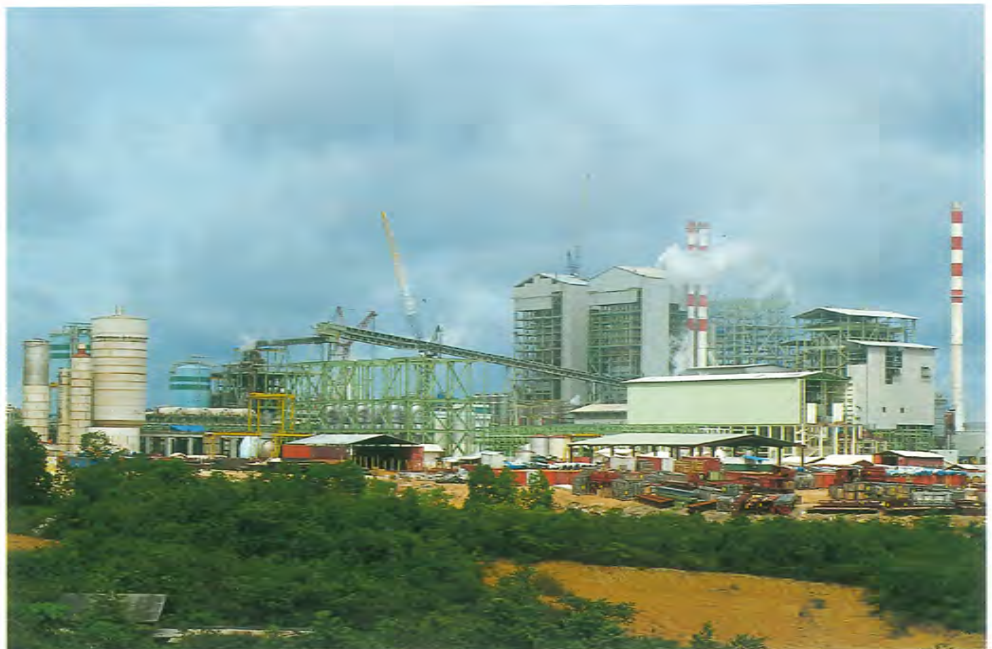
Aprilin sellutehdas Riaussa Sumatralla. Tehtaan tuotantokapasiteetti on noin 750 000 tonnia vuodessa.

paikallinen käyttö on vahvuus. Kaikki kuitupuun ensiasteinen prosessointi tehdään paikallisesti, mikä tarjoaa työpaikkoja ja luo kysyntää paikallisille palveluille. Toisaalta puuraaka-aineen hyödyntäminen on joissakin tapauksissa tehotonta johtuen muiden alueen metsäkonsessiohaltijoiden kyvyttömyydestä markkinoida APRILin konsessioalueilta kaadettavia tukkeja. Hakkuualueille jäävän kuitupuun määrä ylittää edelleen joissakin tapauksissa salitun määrän.