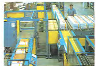
Nordland Papierin arkkisalin A4-tuotantolinjat vastasivat lähes täysin Kymin tuotantolinjoja.

Jämsä naureskelee. Kymistä Nordland Papierin työntekijät eivät miesten mukaan tienneet paljoakaan.