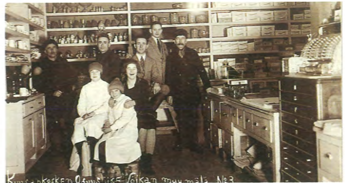
Osuuskauppa ”Kolmosen” myymälässä 1927.