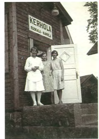
Neitokaisia yhtiön ruokalahvila Kerholan ovensuussa vuonna 1931.