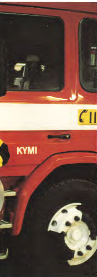
ntolautasen kanssa. Henkilökohtai-