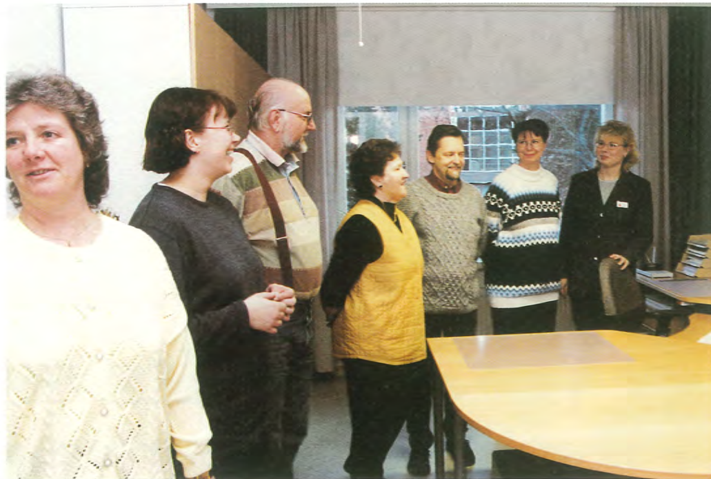
Lähes sata vierailijaa oli noudattanut kutsua. Tässä tutustaan työvoimatoimiston tiloihin.

Voikkaan henkilöstöhallinto ja työterveysasema toimivat nyt uusituissa tiloissa samassa talossa