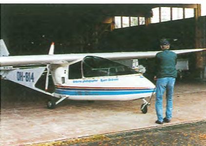
HP-21-moottoripurjekone lentotunnuksin OH-814. Kone painaa lentokunnossa noin 600 kg ja se liikkuu maassa miesvoimalla hyvin.

S elkäni takana moottorin kierros-luku nousee ja aavistuksenomainen tärinä antaa selviä viitteitä siitä, että Porschen 98 hevosvoimaa ovat valmiina tositoimiin.