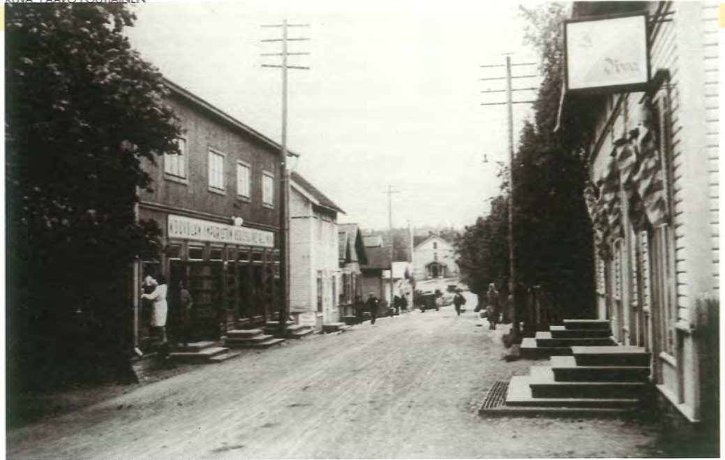
Näkymä Osuuskauppojen kohdalta tehtaalle päin 1920-luvulla. Oikealla ”Kolmonen” ja vasemmalla Ympäristön rakennus. Sen takana vaalea Reimanin liikerakennus ja Ikäheimosen, Janssonin ja Huuskosen liiketalojen päädyt. Tien päässä Riitalan kasarmi.

Tienvarren taloista seuraavassa oli Elokvateatteri Iltatähti, joka oli perustettu vuonna 1924 ja palanut jo kerran aikaisemmin heti seuraavana talvena. Palon jälkeen