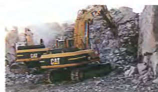
Louhintatyöt ovat jo täydessä käynnissä.