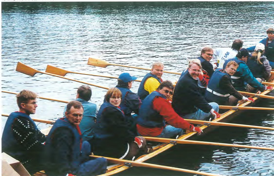
Seminaarin osanottajat ehtivät kokeilla myös kirkkovenesoutua Repoveden jylhissä maisemissa.