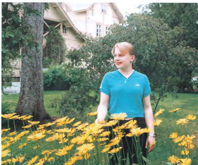
Milla tähyää jo tielle lomalaisia odottaessaan.