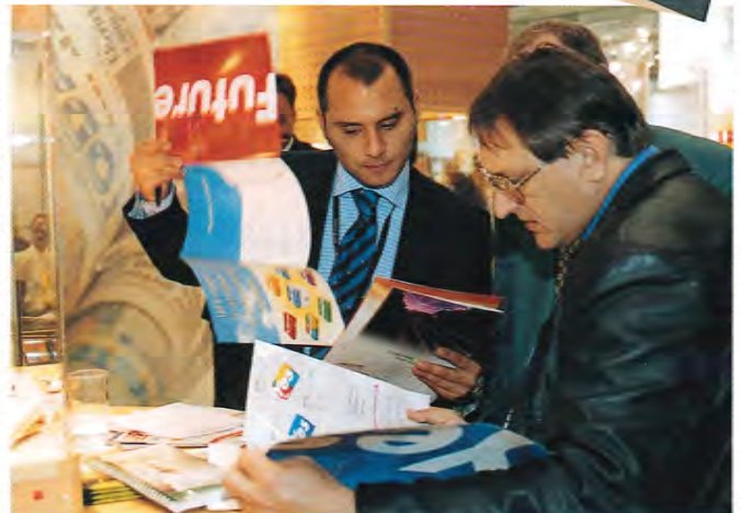
Yes ja Future kiinnostivat.

Yleinen suuntaus messuilla oli digitaalisuus ja verkottuminen. Offsetpainokoneita on kehitetty voimakkaasti digitaalitekniikan mahdollisuuksia hyödyntäen, mikä näkyi selvästi messuilla. Kuntoonlaittoajat ovat lyhentyneet muutamiin minuut-