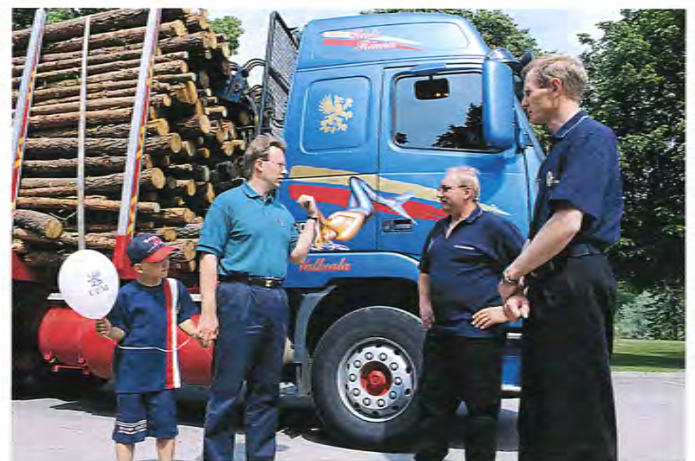
Iltpäivän kahvituokio innosti jatkamaan tutustumista metsäalaa.