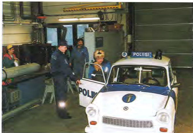
Nyt viedään miestä eläkkeelle!

TEKSTI: KATJA KUOKKANEN