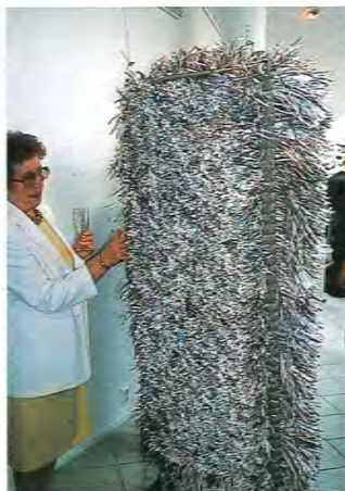
Paperitaidegallerian näyttelyssä oli mielenkiintoista “hypisteltävää”(yllä).

Paperitaidegalleriassa järjestetään vuosittain 4-5 korkeatasoista näyttelyä. Kymmenvuotisjuhlanäyttely on järjestyksessä 47:s. ■