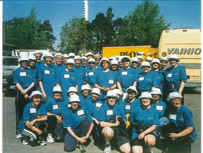
Kymin ja Voikkaan naisia Naisten Kympein tunnelmissa aurinkoisessa Helsingissä toukokuun lopussa.

Reitti oli tällä kertaa aivan uusi. Se kulki pitkin Helsingin kauneimpia maisemia sekä nähtävyyksiä: Hietaniemen rantojen, Sibeliuspuiiston ja kesärannan ohi, Mäntyniemen ja Tamminien vieritse. Reitin varrella kuullimme useiden kvartettien laulavan serenadeja. Maali oli olym-