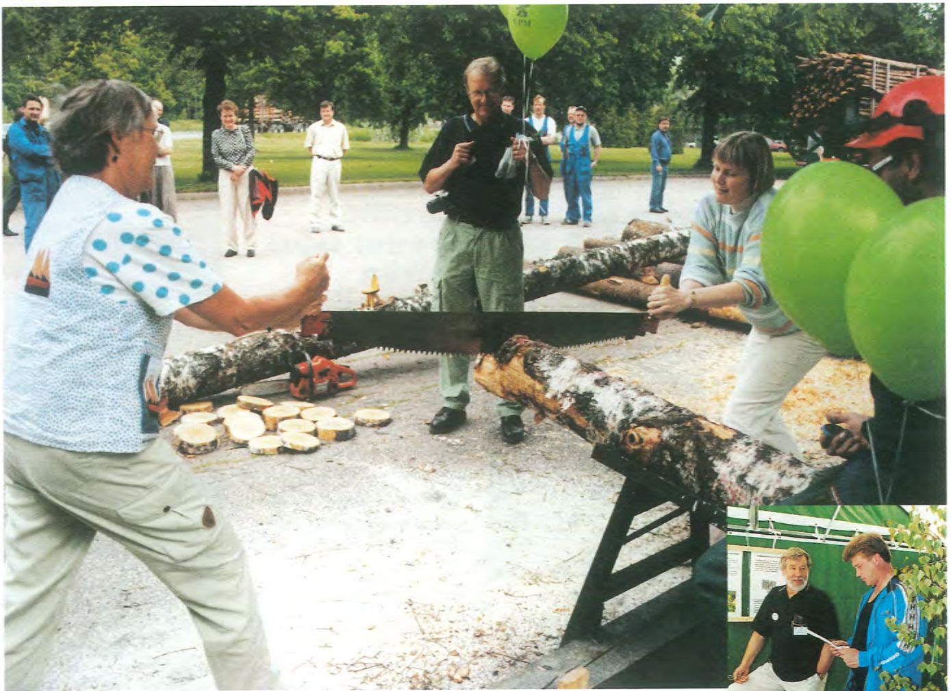
Justerinkäyttöharjoituksia kesäisenä iltapäivänä.