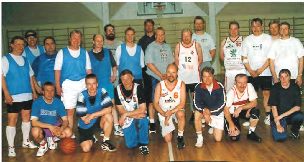
Koripallokauden päätteeksi Kouvojen seniorit, kymiläiset koripalloilijat ja kuusankoskelaiset opettajat pelasivat keskenään turnauksen. Voitot menivät ristiin - kaikki voittivat yhden ottelun.