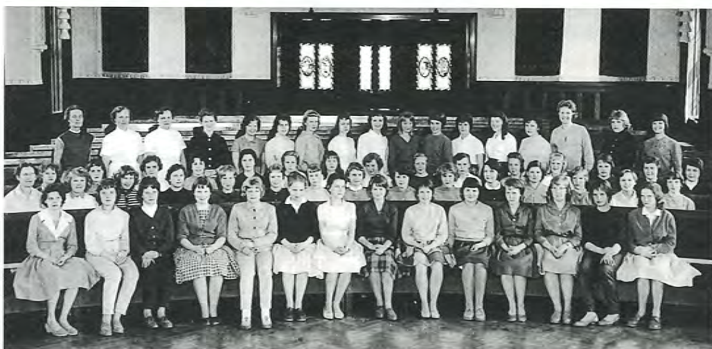
TEKSTI: IRMA NIEMI