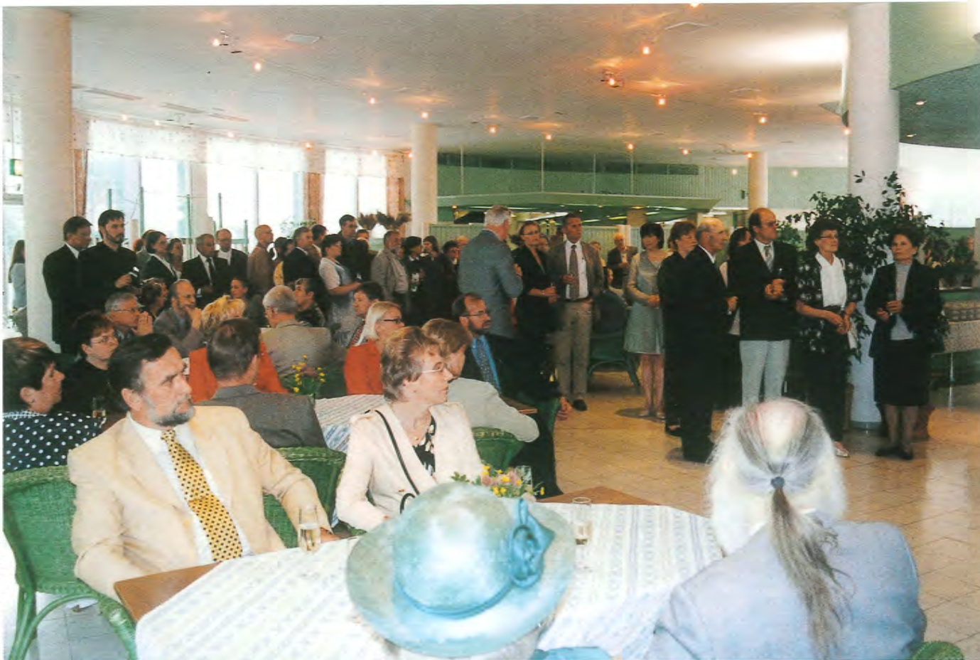
Kolmikymmen 10-vuotisjuhlaan Kymen Paviljonkiin oli saapunut noin 160 kutsuvierasta.