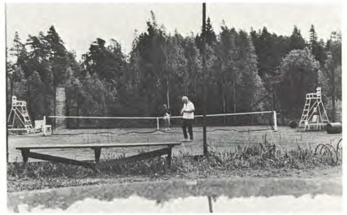
Karkkilassa olisi kyllä tenniksen harrastajia, mutta heiltä puuttuu pelikenttiä. Paikkakunnan ainoan kin kentän pohjustus on tehty niin heikosti, että sen kunnostaminen vie keväisin paljon aikaa.

Tenniskurssit pidettiin Juantehtaalla viimeksi vuonna 1975. Yhtiön muiden tehtaiden kanssa ei ole mitattu taitoa. Haastelistaakaan ei ole ollut käytössä, vaan paremmuutta on ratkottu keskinäisin otte- luin.