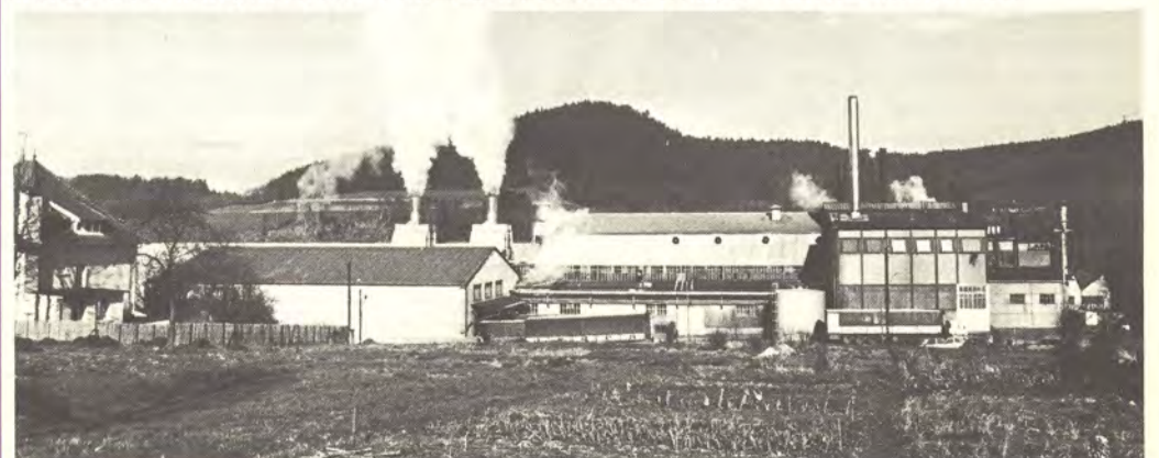
Papeteries Boucher'illa on Ranskassa kaksi paperitehdasta. Toinen sijaitsee Englannin kanaalin rannikolla Calais'ssa, toinen Docelles'ssa Koillis-Ranskassa (kuvassa).

Ranskalaistehtaille tulevaisuudessa vietävän sellun määrä riippuu Kymiyhtiön Kuusankoskella sijaitsevien paperitehtaiden selluntarpeesta ja toisaalta koivusel-kuivauskapasiteetin kehityksestä.