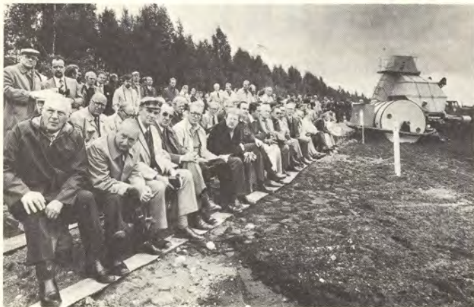
Turvekoneenäyttelyssä Haukkasuolla riitti katsojia, onhan turpeen osuus energianlähteenä kasvamassa. Polttoturvetta käytetään Suomessa viisi lämpövoimalaa, turpeesta saadaan 2 % maan energian tarpeesta.

● Kahdeksan turvekoneiden valmistajan laitteita oli esillä Kymiyhtiön Haukkasuolla elokuun 8.–10. päivinä järjestetyssä turvekoneenäyttelyssä. Turvekoneenäyttely liittyi kansainväliseen turveteollisuutta ja turvetuotantoa käsittelevään symposiumiin, joka pidettiin Kouvolassa 7.–11. elokuuta.