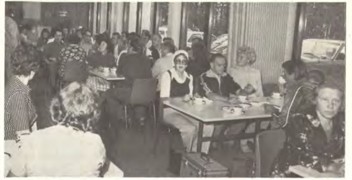
Pytynlahti sijaitsee Pyhäjärven rannalla Iitin Lyötilässä.

Ympäristönsuojelun vuotuiset käyttökustannukset ovat Kymi-yhtiössä n. 6 mmk. Palauttamalla jätteitä tuotantoon saadaan kustannuksista takaisin lähes kolmannes.