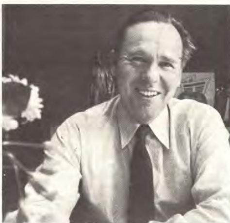
Kansanedustaja Markus Kainulainen