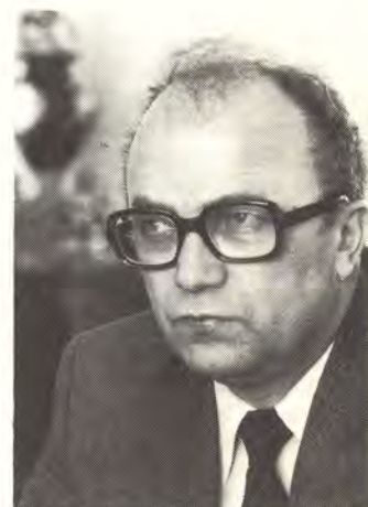
Valtiovarainministeri Paul Paavela

Edellä mainittujen myyntiyritysten lisäksi suomalaiset yritykset ovat perustaneet ul-