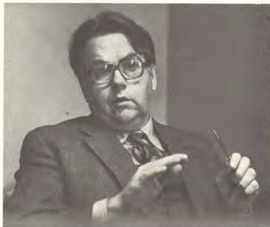
Kansanedustaja Taisto Sinisalo