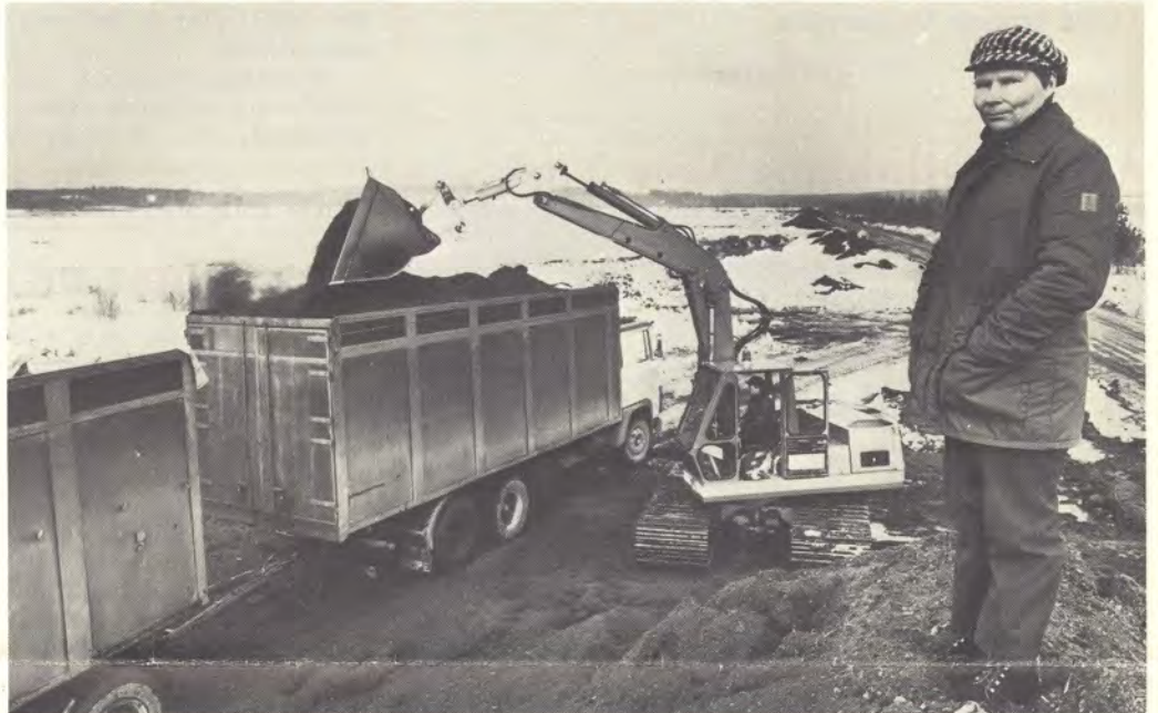
Kenttätöyönjohtaja Niilo Hartikainen turveaman päällä. Talveksi turvetta varastoitaessa on auman harja muokattava teräväksi veden johdattamiseksi maahan. Turvetta kuljetetaan Haukkasuoilta Kuusankoskelle kahdessa vuorossa.

Talvinen turpeenajo vaatii runsaasti teiden tekoa ja kunnossapitoa — suon päälle tehtävät tiet kestävät vain mikäli ne pääsevät jäätymään tarpeeksi syvältä.