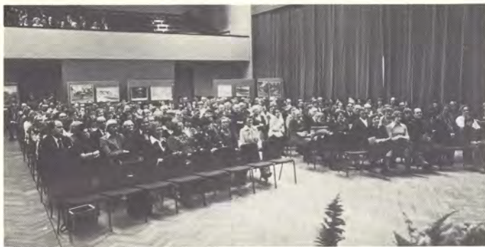
Yhtiön seurataloon Voikkaalle oli tullut yleisöä 300 henkeä kuuntelemaan ohjelmaa kotiseudustaan.