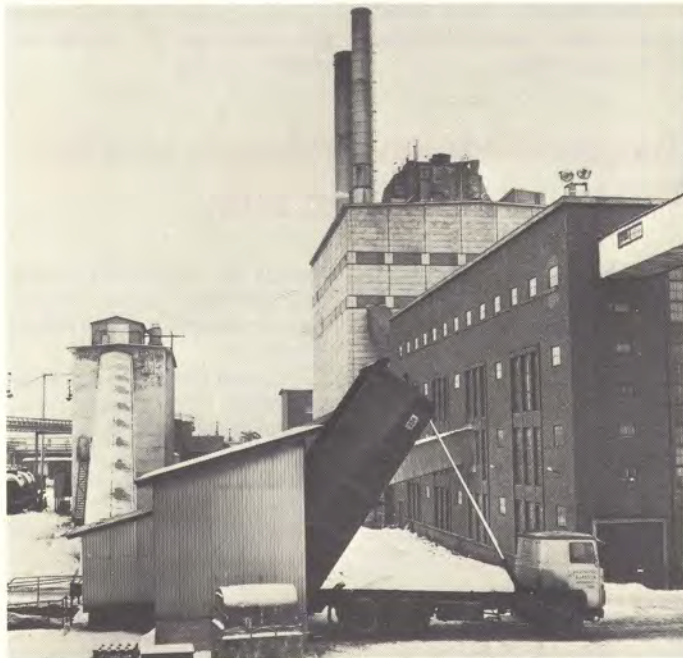
Kymmin höyryvoimalaitos, etualalla jyrshinturpeen vastaanotto, vasemmalla turvesiilo.

joudutaan usein sopeuttamaan kuorimäärien mukaan.