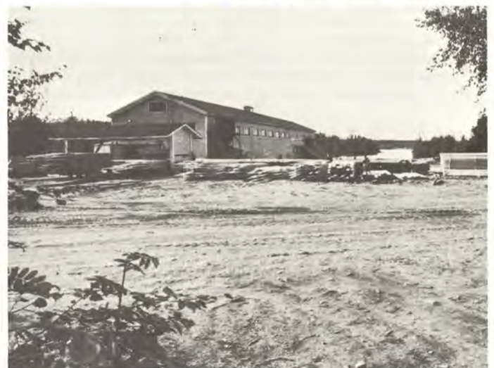
Juankosken saha sijaitsee luonnonkauniissa Pikonniemessä. Sahan purkamisen jälkeen niemeen on suunnitteilla asuntoalue.

Ennätystä juhliittiin kaksipäiväisillä kahvikekkereillä. Koko tehtaan väki, yhteensä 290 henkeä, kestitettiin useassa vuorossa.