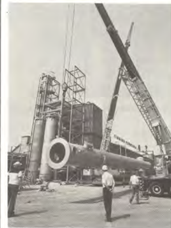
Uusi uuttokolonni asennettiin paikoilleen kesäkuun alussa Voikkaalla.

Oy Finnish Peroxides Ab:n laajennustyömaalla nostettiin kesäkuun alussa paikalleen 28 metriä pitkä uuttokolonni. Kolonnin paino lisälaitteineen on noin 10 tonnia, halkaisijaltaan se on 1420 mm.