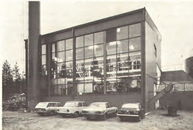
Yksinomaan haketta ja palaturvetta käytetään polttoaineena Kymi Kymmene Metallin Heinolan tehtaalla Virtain kaupungin aluelämpökeskukseen toimittamassa Högfors 36 JET-arinakattilassa. 3.5 megawatin kattila huolehtii laitoksen peruslämpökuormasta.

Kyseisiä kattiloita toimitettiin vuoden 1979 aikana kaksi kappaletta sekä Lapu-