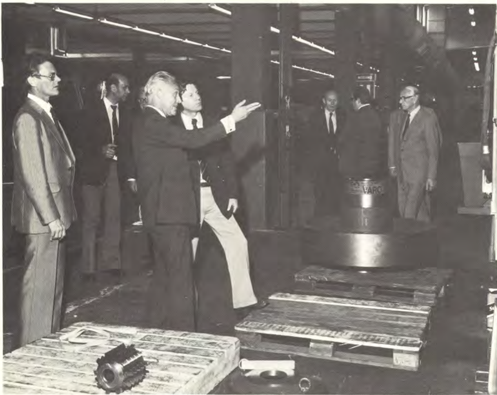
Kymiyhtiön hallitus piti kevätkokouksensa kuluvana vuonna 18.6. Karkkilassa ja tutustui samalla Kymin Metallin Karkkilan valimoon ja konepajaan. Santasalovaihteiden valmistusta hallitus seurasi mm. uudistetussa koneistushallissa.