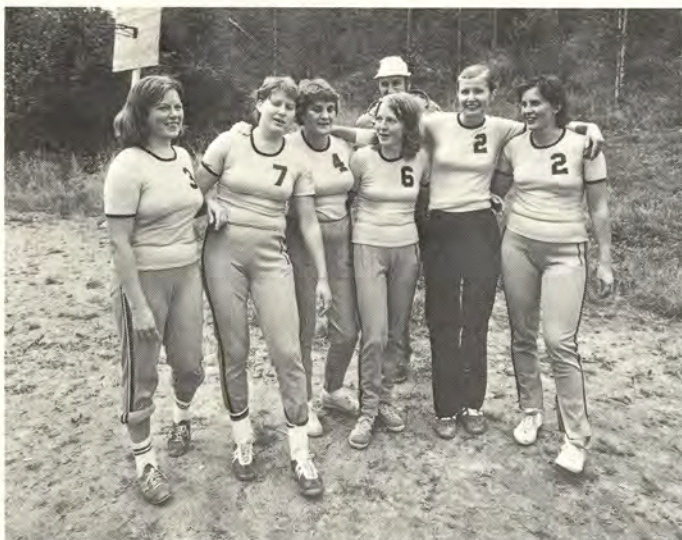
Naisten lentopalloturnauksen voitti Voikkaan joukkue.