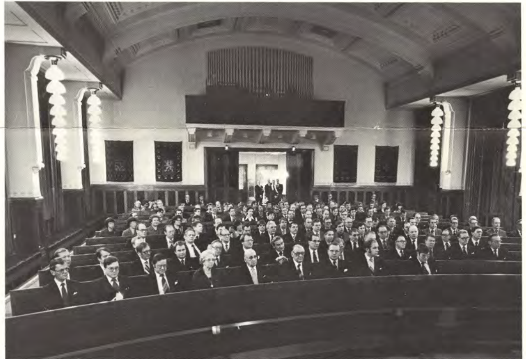
Työterveyden ja työsuojelun juhlaan Kymiyhtiön juhlasaliin ammattikoululle oli kerääntynyt lähes 200 juhluvierasta. Kutsuvieraiden lisäksi mukana olivat työsuojelu- ja työterveysosastojen edustajat jokaiselta yhtiön tehdaspaikkakunnalta.

korjaus on osoittautunut vaaralliseksi”, totesi Riikonen.