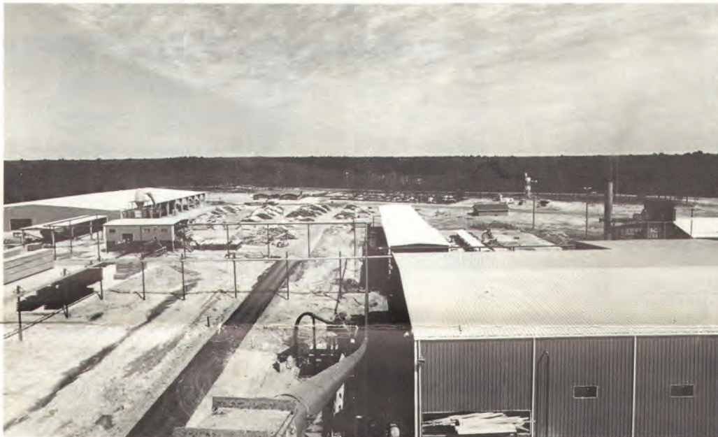
Suunnitteilla oleva sellutehdas on tarkoitus sijoittaa Leaf Riverin sahalaiteksen välittömään läheisyyteen. Leaf Riverillä on Yhdysvalloissa 600 hehtaarin suuruinen teollisuusalue. Ensimmäiset tukit sahalla ajettiin läpi prosessin tammikuussa 1977.

□ Kuten julkisuudessa on hiljattain kerrottu, on Kymiyhtiö tehnyt esisopimuksen amerikkalaisen Great Northern Nekoosa -yhtiön kanssa uuden sellutehtaan perustamisesta Yhdysvaltoihin. Yhtiöiden suunnitelmaan kuuluu rakentaa 300 000 tonnia valkaistua sellua valmistava tehdas Kymiyhtiön tytäryhtiön Leaf Riverin omistamalle teollisuusalueelle New Augustassa, Mississippin osavaltiossa.